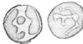
TYPE (3) DES POTINS « A LA TÊTE DIABOLIQUE ».

En 1942, M. R. Adam (1) , eut la bonne fortune de trouver, dans des « crayats des Sarrazins », au lieu dit « Vert Chemin » à Yves-Gomezée (2) , une monnaie gauloise dont voici la description :