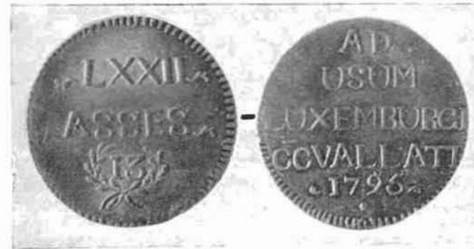
1) Couronne de 72 AS 1795 Argent.

Très tôt pendant le siège, le numéraire vint à manquer mais le métal ne faisait pas défaut (on avait transporté les trésors des environs, principalement des églises, dans cet asile présumé sûr). Il fut décidé le 13 janvier 1795 de faire fabriquer des Kronentaler d'argent de 72 sols et pesant une once (13 löthing comme indiqué sur les pièces) et des pièces d'un sol, faites avec un cuivre jaune allié d'un autre métal provenant des vieux canons. Après le siège, ces pièces furent abondamment copiées par des faussaires qui usaient de la facilité du surmoulage, les pièces originales étant elles-mêmes coulées. Il reste très malaisé de déterminer si l'on se trouve devant une imitation ou non, tous les degrés de dégénérescence existant. Cependant le procédé du surmoulage faisant théoriquement perdre du volume à la pièce batarde, on peut considérer qu'il existe deux types différents, le second ayant trois (ou plus) mm. de moins en module que le premier. Les petits modules, ou imitations certaines gardent leur intérêt et sont à notre avis à collectionner. Pour terminer signalons que dans la RBN 1894 est signalée l'existence d'un exemplaire de meilleure facture et qui a été frappé au balancier. Personne n'a jamais vu cette monnaie fantôme et divers auteurs s'abstiennent de la signaler. Nous ajouterons que l'auteur qui a signalé cette pièce n'était pas à sa première bévue comme en témoignent des écrits de ses confrères de l'époque.