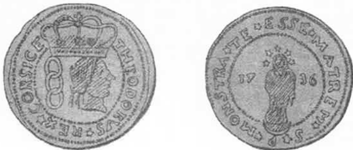
STUK VAN 1/2 SCUDO OP NAAM VAN THEODOOR

Hij dreef de stoutmoedigheid zover zijn troonsbestijging aan de senaat van Genua mede te delen.