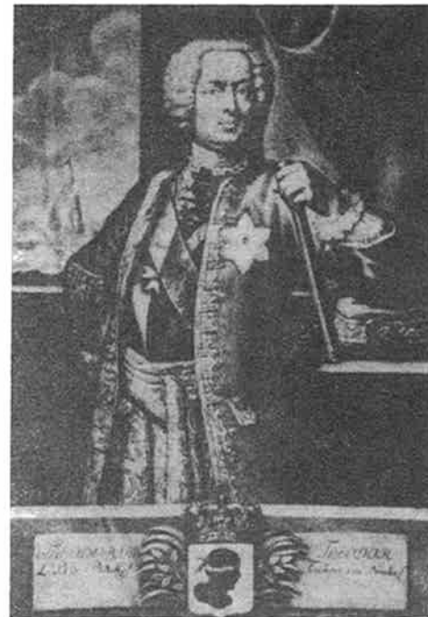
THEODOOR I KONING VAN CORSIKA

Intussentijd had hij in Spanje, naar men zegt, een lelijke en twist-zieke vrouw gehuwd die hem een dochter schonk. Maar hij verliet dit ongewenste gezelschap, nam haar juwelen mede en tegelijkertijd vond hij het geraadzaam de fondsen, die hem toevertrouwd waren