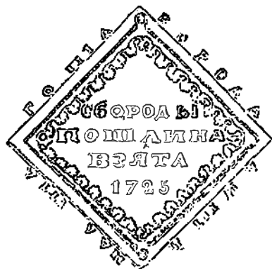
BAARDENGELD VAN 1725, VOLGENS W. HAWKINS

heid, hen te doen gevoelen, door de hindernissen medegebracht bij de meest onschuldige beoefening van de vrijheid door de eenvoudigste handelingen, dat de macht van de despoot onbegrensd is, dat er niets bestand is tegen zijn grillen en dat hij zo het hem bevalt zich evengoed kan amuseren met in een menselijk gelaat te hakken zoals men de taxisboom hakt in onze tuinen. M. P.