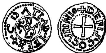
AFB. 1 (GARIEL, 224, PL. XXIX, N° 97)

In 1883 beschrijft E. Gariel — volgens gegevens van R. Serrure — in: Les monnaies royales de France sous la race des Carolingiens, deze munt van Kuringen als volgt: « au droit: la légende + CDA TIAD- I FEX, entre deux grénétis, avec au centre un monogramme très barbare: C D S L; — au revers, la legende + DE FISCO CVRINIO entre deux grénétis; au centre, une croix ». (afb. 1).