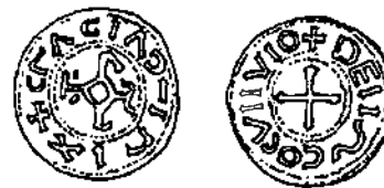
AFB. 2 (GARIEL, 224, PL. XXIX, NR 98)

Spijtig genoeg is er tot nog toe slechts één muntstuk met DE FISCO CVRINIO bekend nl. dit uit de verzameling Gariel (nr 97 — bij Serrure nr 935 — pl. VII nr 4), waarvan Gariel in 1883 de waarde schatte op 100 fr. en dat in 1884 voor 295 fr. verkocht werd en waarvan men niet weet wat er mee gebeurd is. Wel kocht het Franse Muntenkabinet uit dezelfde verzameling voor 200 fr. (schatting Gariel was 75 fr.) een variëte van de denier CVRINIO met als tekst + DEII ~ CO CVIIVIO waarvan Vannérus ook liefst CVVINIO of Couvin maakt. (afb. 2).