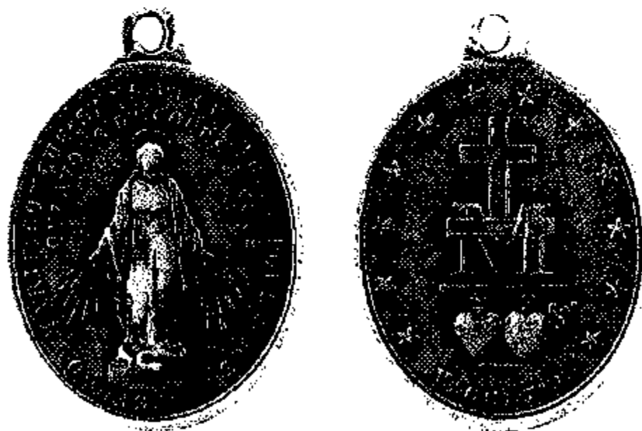
Vachette Type II

(originele grootte - oog niet inbegrepen - : 22,5 mm hoog)