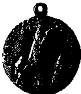
T.15/3 witmetaal 42 mm.