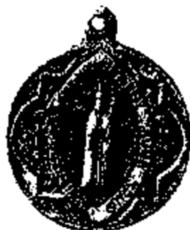
T.7 aluminium Ø 36 mm.