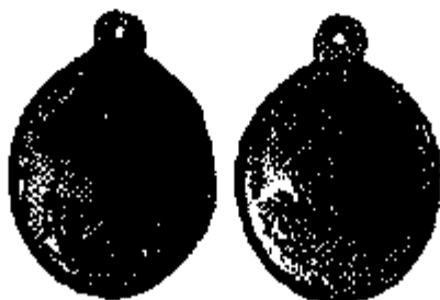
T.13 geelkoper 34 x 28 mm.