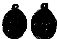
T.11/1 geelkoper 20 x 16 mm.