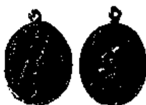
T.3/2 zilver 25 x 21 mm.