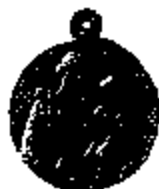
T.14/5 witmetaal Ø 24 mm.