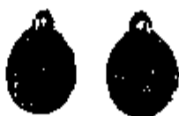
T.10 silver 16 x 12 mm.