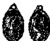
T.20 zilver 17 x 11 mm.

En tenslotte : O.L. VROUW VAN SCHERPENHEUVEL (T. 15/3). Met lang bestaan van dit type gaf ook weer aanleiding tot heel wat keerzijden. Vooral met de kerk - "sanctuaire" of "basiliek" -, met geliefde madonna's of met het H. Hart.