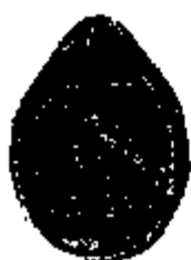
T.1 zilver 29 x 21 mm.