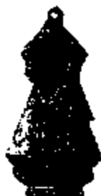
T.5 zilver 36 x 20 mm.