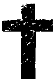
T.2 zilver (rug gevuld met hout) 35 x 23 mm.