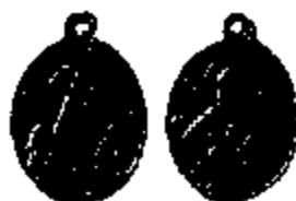
T.16 aluminium 23 x 18 mm.