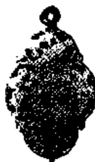
T.6 zilver 42 x 31 mm.