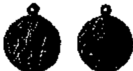
T.19/2 similar Ø 18 mm.