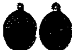
T.8 geelkoper 22 x 16 mm.