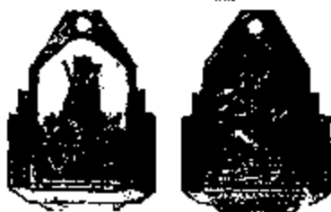
T.18 witmetaal 30 x 21 mm.