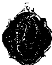
T.15/1.a aluminium 29 x 27 mm.

Hier is de Nederlandse tekst in kleinere kapitalen - aan de top van de boom - bijgevoegd.