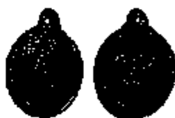
T.11/2 silver 22 x 19 mm.