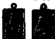
T.17 similar 17 x 12 mm.