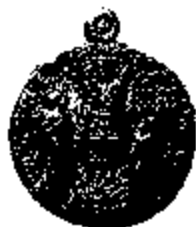
T.14/1 witmetaal Ø 29 mm.

Op al deze exemplaren komt er maar één vandschrift voor : NOTRE DAME DE MONTAIGU.