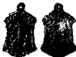
T.19/3 aluminium 26 x 16 mm.