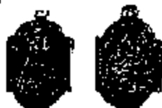
T.9 aluminium 20 x 14 mm.