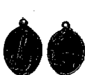
T.19/1 witmetaal 24 x 19 mm.

Daar zijn er ook nog enige met op de keerzijde enkel een gestyleerd takje bloemen, wat genoeg plaats overliet om er, naar de smaak van de koper, een tekstje bij te graveren (T. 19/1-19/2, 19/3). Hier past de label : Jugendstil - Art Nouveau.