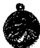
T.14/6 witmetaal Ø 20 mm.