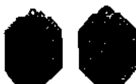
T.4 zilver 18 x 20 mm.