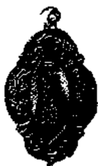
T.6 zilver 42 x 31 mm.

De Brusselse hofhouding van de Aartshertogen sprak Frans. Vandaar het volksvreemde toponiem "Montjiru", dat gedurende eettelijke generaties als het semi-officiële naamkaartje van Scherpenheuvel gold. Wij menen dat deze medaille, die in verschillende formaten bestaat, dagtekent uit het tweede kwart van de 17de eeuw.