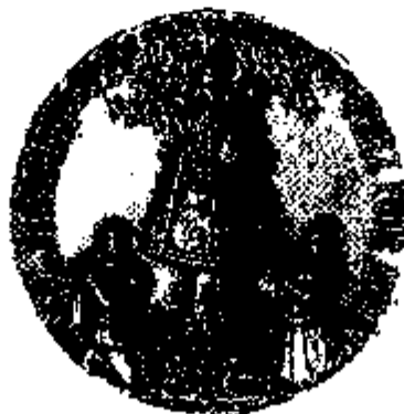
T.15/2 aluminium ø 50 mm.