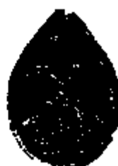
T.1 zilver 29 x 21 mm.