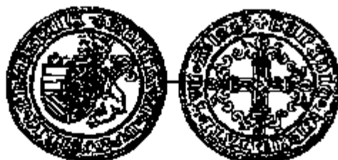
Vuurijzer 1683 Eerste emissie

Gedurende de eerste, derde en vierde emissie was het wapenschild geen anders (11).