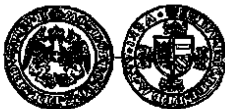
Dubbele griffioen 1687 Derde emissie