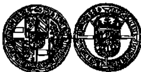
Stofvar 1489 Vijfde emissie

Voor de rest is er volledige overeenkomst tussen het wapenschild op deze munten en dat op de besproken penningen. Deze laatste munten dus waarschijnlijk na 14 december 1489 (datum van de ordonnantie die de modaliteiten van de vijfde muntmissie vastlegt) geplaatst worden. Voor een preciezer dataring moet wel een onderscheid gemaakt worden tussen de penningen van het eerste en van het tweede type.