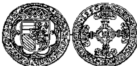
Dubbele stuiver 1496 Zevende emissie

1489 en augustus 1493/1494. Vermits op de munten toch geen barensteel voorkomt en het wapen van de andere rekenpenning ook hetzelfde is als op de munten van de vijfde emissie, kan deze dus ook dateren van na 14 december 1489. Een uiterste einddatum voor deze laatste is vanzelfsprekend de dood van Filips op 25 september 1506 (20). Op de munten van de zevende emissie (vanaf 14 mei 1496) en van de achtste emissie (20 februari 1500 - 14 februari 1506) treft men echter een vereenvoudigd schild aan (gekwartileerd (1) Oostenrijk, (2) Nieuw-Bourgondië, (3) Oud-Bourgondië, (4) Brabant en hartschild Vlaanderen)(21), zodoende dat in ieder geval 1496 als einddatum voor deze rekenpenningen zou kunnen vooropgesteld worden.