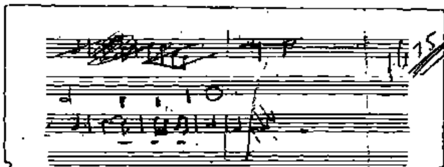
Fig. 1 : Schets van de eerste maten van de "Internationale" door René Boschmans