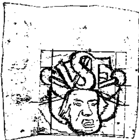
Fig. 2 : Schets van het eerste type eretaken door René Boschmans