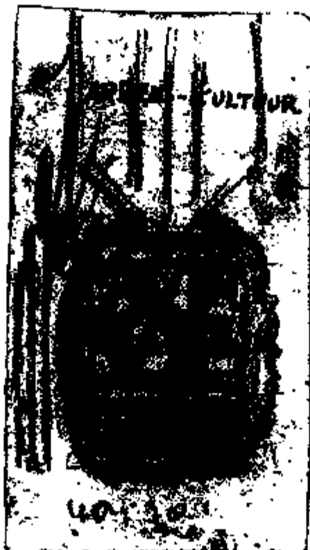
Fig 5 : Schets van het derde type ereteken door René Boschmans

Na de eerste bestelling volgden er nog andere, soms met een zeer groot tijdsinterval. Daardoor bestaan er kleine verschillen in de afmetingen, en vertoont het email varianten in tint en structuur; de ring loopt nu eens door een bolvormig draagpog bovenaan het ereteken, dan weer door een ringvormig oogje op de keerszijde. Ook de naam van de kluantenaar op de keerszijde varieert (Boschmans, BOSCHMANS of R. BOSCHMANS) en soms ontbreekt die van het atelier.