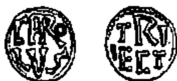
Zilveren denarius Karel de Grote als koning (768 - 794) Maastricht