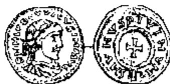
Gouden solidus Lodewijk de Vrome

B. Hilliger wijdde tussen 1903 en 1935 verscheidene werken aan de monetaire problemen die de barbaarse wetten - en meer bepaald de Friese - stellen. Eerst beschouwde hij de passages met vermeldingen van tremisses als late interpolaties 18/ , maar hij schijnt dit onderscheid tussen denier en tremissis vrij vlug te hebben opgegeven 19/ . Volgens hem rekenden alie barbaarse wetten, zelfs de Lex Hibuaria , met gouden solidi 20/ . Zo kon er geen sprake meer van zijn de verandering van standaard in te roepen om de lage boeten in de Lex Frisionum te verklaren. Daarom moest Hilliger de in deze wet vermeldde denier een zeer hoge waarde toekennen: hij identificeerde hem met de gouden solidus van Lodewijk de Vrome (814-843) met het omschrift munus divinum .