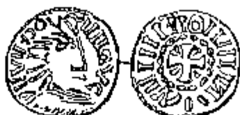
Gouden solidus Friese imitatie van de gouden solidus van Lodewijk de Vrome

Andere auteurs hielden voorzichtig rekening met de muntvondsten. A. Dopsch 23/ , gevolgd door R. Schröder 24/ , waren niet alleen geïnspireerd door de schat van Ilanz 25/ , maar eveneens door de vondst van een barbaarse gouden solidus in Friesland zelf 26/ , die later geïdentificeerd werd als barbaarse imitatie van de munus divinum en derhalve merkelyk recenter dan oorspronkelijk gedacht 27/ .