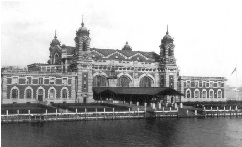
De immigratiehal van Ellis Island vóór 1903

Het eerste gebouw dat dienst deed als immigratiehal was Castle Clinton, ondertussen Castle Garden genoemd, van 1855 tot 1890. Het stond onder toezicht van de stad New York en werd uiteindelijk gesloten door de federale overheid als gevolg van een te grote corruptie van het personeel. Gedurende een jaar deed Barge Office, een plaats in Battery Park in het zuiden van Manhattan dienst als immigratiestation, terwijl men naarstig zocht naar een betere oplossing. Ondertussen was de immigratie terug opgelopen tot 250.000 per jaar.