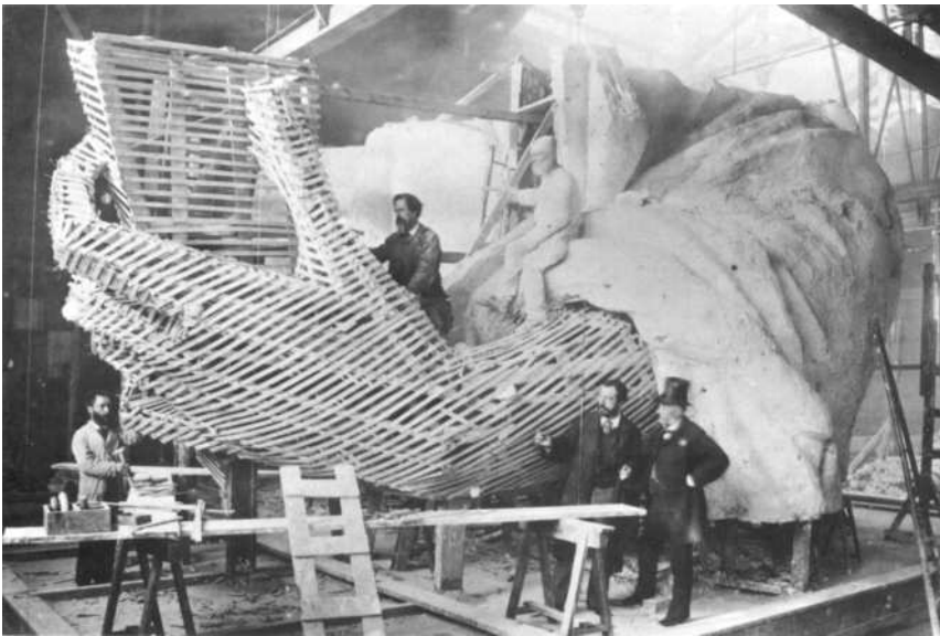
Constructie van het Vrijheidsbeeld in Parijs. De tweede van rechts is Bartholdi

Hij voer naar New York in 1871. Het binnenvaren van de haven had een bijzonder effect op hem: de toegang tot de Nieuwe Wereld zou de ideale plaats zijn voor het Vrijheidsbeeld. Het uitzicht van het Vrijheidsbeeld kreeg ook een concretere vorm in zijn geest: het zou de vorm krijgen van een klassieke godin: de vlammeende toorts en de kroon zouden de vrijheid symboliseren; de zeven punten van de kroon zouden het uitstralen van de vrijheid naar de zeven continenten en de zeven oceanen voorstellen; aan de voet van het beeld zouden gebroken kettingen de vrijheid van de tirannie betekenen; de godin zou een tablet dragen met de datum van de Amerikaanse onafhankelijkheidsverklaring: 4 juli 1776.