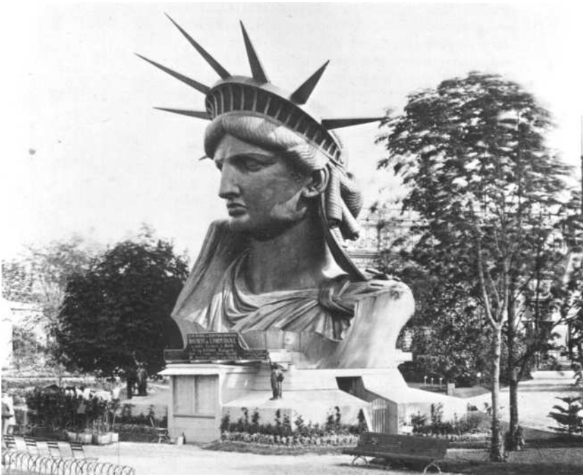
Het hoofd van het Vrijheidsbeeld op de Parijse Expo van 1878

In 1875 werd in Frankrijk de “Union Franco-Americaine” gesticht onder het voorzitterschap van Eduard de Laboulaye, en met invloedrijke Franse personen als leden, waaronder ook afstammelingen van de helden van de Amerikaanse Revolutie zoals La Fayette. De plannen van het gezamenlijk project tussen de twee landen werden uitgewerkt: Frankrijk zou het beeld maken en betalen en later verscheppen naar Amerika; Amerika zou het stenen voetstuk maken en betalen. Ondertussen was al wel duidelijk dat het beeld niet klaar zou zijn voor de 100ste verjaardag van de onafhankelijkheid.