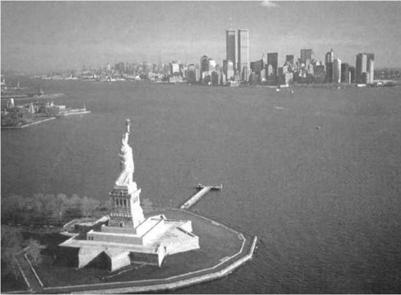
Vooraan Liberty Island, links Ellis Island, achteraan Manhattan

hoofd kon reeds getoond worden op de Parijse Expo van 1878, waar de bezoekers mits betaling het inwendige konden bezichtigen. Het beeld bestond uit koperen platen op een ijzeren geraamte. Bartholdi werd geholpen door Gustave Eiffel, de latere bouwer van de Parijse Eiffeltoren, die het ijzeren geraamte bouwde. In 1881 waren de nodige 400.000 $ voor de bouw van het beeld in Frankrijk reeds ingezameld. Het beeld was klaar in 1885; het was 46,5 meter hoog en woog 225 ton. Het beeld werd in Parijs gedemonteerd en de onderdelen werden verpakt in 214 houten kisten en per boot naar New York gebracht.