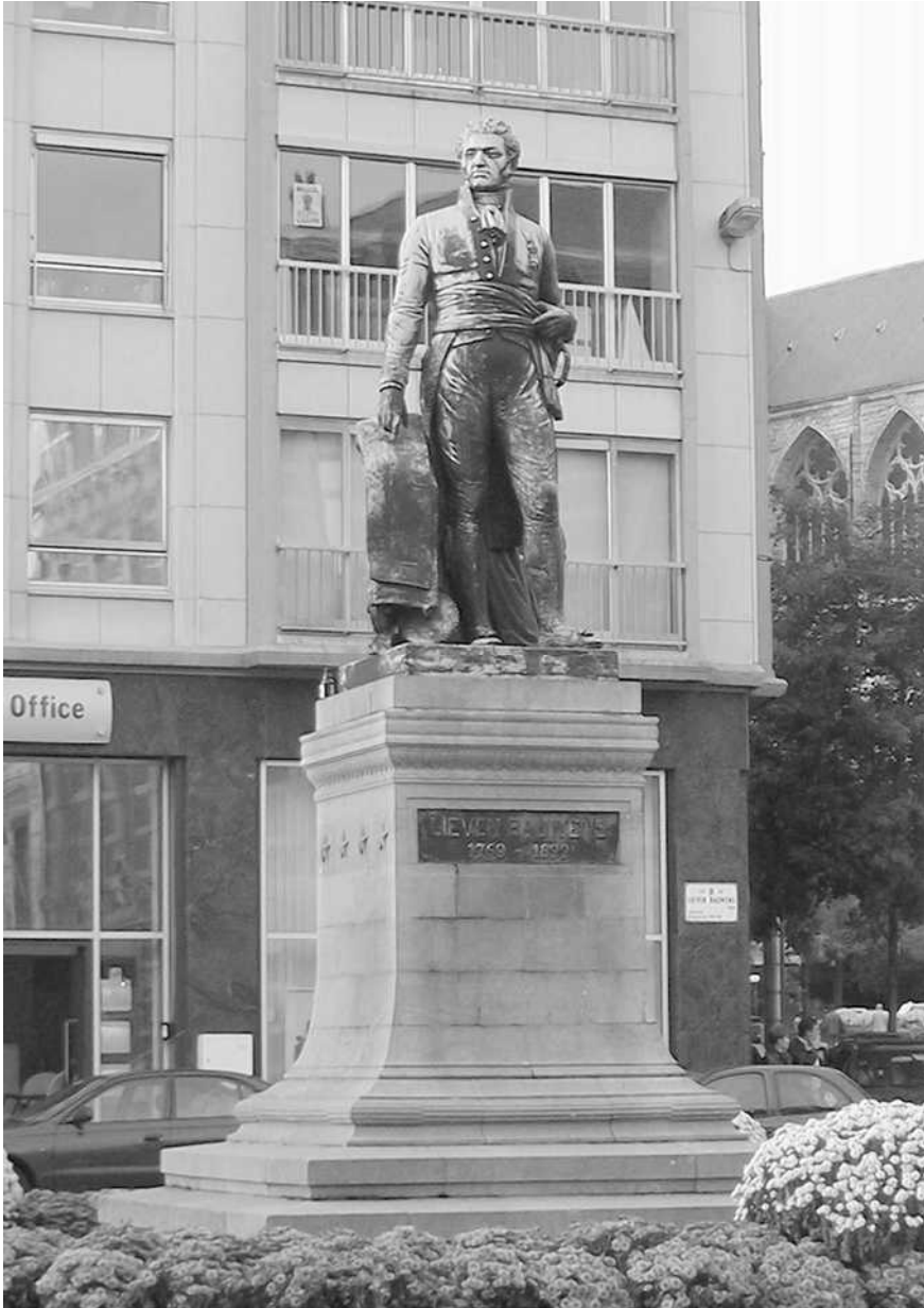
Standbeeld van Lieven Bauwens op het Lieven Bauwensplein te Gent