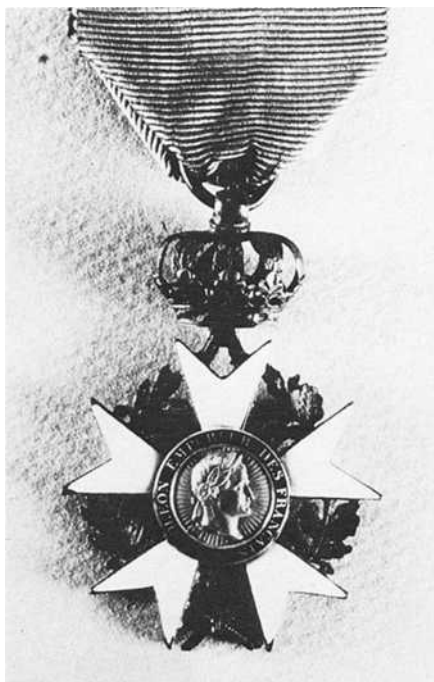
Lieven Bauwens' ereteken als Ridder van het Erelegioen