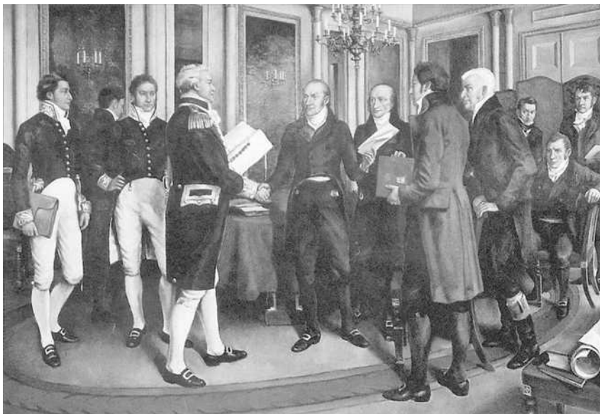
Schilderij van sir Amedee Forestier van de onderhandelaars van de Vrede van Gent, naar portretten van P. Van Huffel