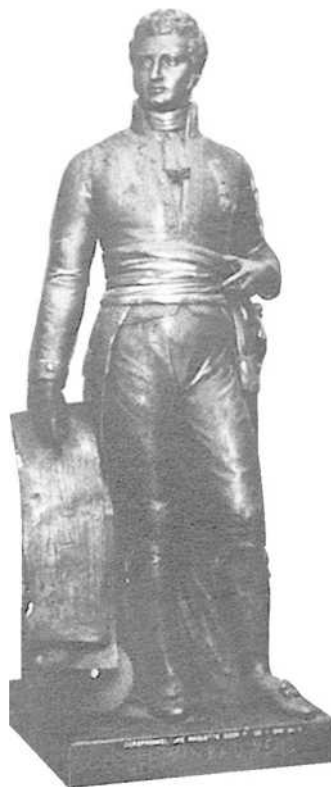
Plaasteren ontwerp door De Vigne-Quyo

In 1822, onmiddellijk na het overlijden van Bauwens, werd het huidige Frankrijkplein tot Lieven Bauwensplein omgedoopt. Een eerste project om voor hem een standbeeld op te richten dateert uit 1837. Omwille van de benarde financiële situatie van de weduwe Bauwens werd echter van het plan afgezien en werden de via de inschrijvingslijst verzamelde gelden aan haar overgemaakt.