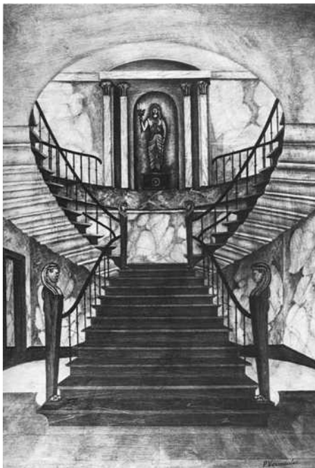
Tekening van de Napoleon-trap door P. Vermeulen