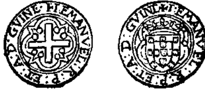
Ducaat (goud) van Emmanuel I van Portugal (1495-1521)