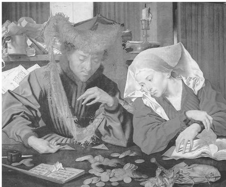
Marinus Van Reymerswaele: De geldwisselaar en zijn vrouw (1539); olieverf op hout, 83 cm x 97 cm, Museo del Prado, Madrid Vooraan op de tafel ligt een muntgewichtdoos.