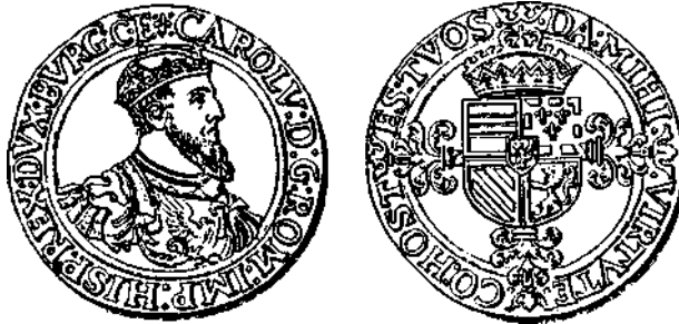
Carolusgulden (zilver) van Karel V (1506-1555)