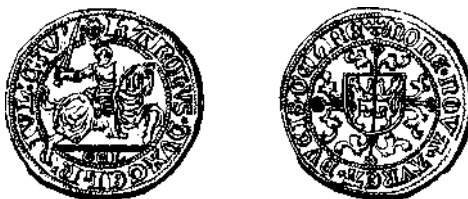
Gelderse rijder (goud) van Karel Van Egmont van Gelderland (1509-1538)