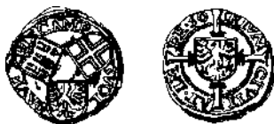
Pleck (billon) van de drie steden Deventer, Kampen en Zwolle (1550)