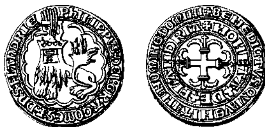
Botdrager (zilver) van Philips De Stoute (1384-1404)