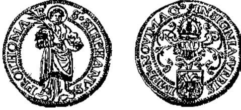
Sint-Stevens, dubbele dukaat van Nijmegen 11

Volledigheidshalve vermelden we ook nog dat Willem van Batenburg (Gelderland, † 1573) ook dubbele dukaten en halve guldens met de afbeelding van Sint-Stephanus liet slaan. Deze gelijken zeer sterk op deze van Nijmegen, evenwel met een ander omschrift op de keerzijde.