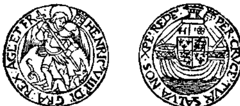
Angelot (goud) van Hendrik VIII van Engeland (1509-1547)