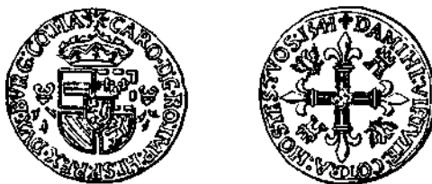
Gouden kroon van Karel V (1506-1555)