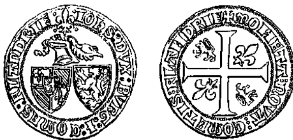
Braspeninck (zilver) van Jan zonder Vrees (1404-1419)