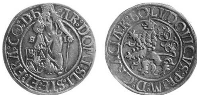
Joachimsthaler (zilver) van de heren van Schlick (1519)