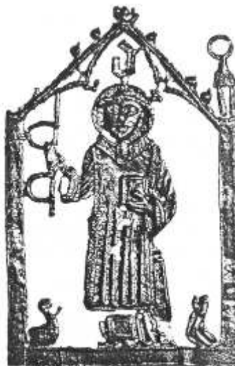
H. Leonardus. Boven het hoofd de Gotische letter ð van Dudzele.

Ik wens duidelijk te stellen dat deze bijdrage geen catalogus is, noch een volledig overzicht. Bij gebrek aan beter zal ik mij beperken tot een beschrijving van enkele medailles uit mijn verzameling, aangevuld met afbeeldingen uit mijn documentatie.