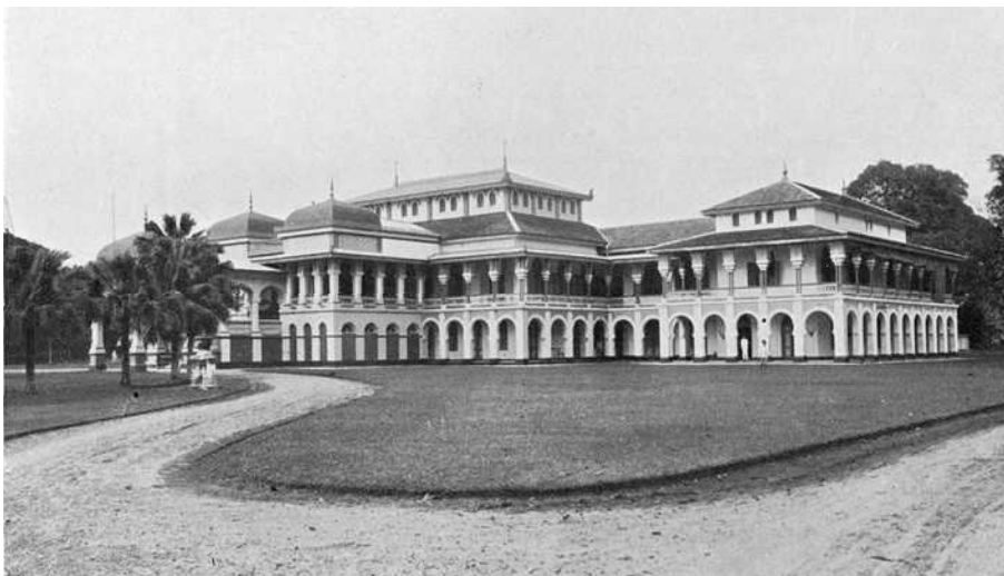
Ontvangpaleis van de sultan van Deli

Wat hem echter meer inkomsten opleverde waren de baten uit de door hem geheven in- en uitvoerrechten over het handelsverkeer van en naar de vele ondernemingen. Eveneens leverde de verkoop en het heffen van belasting op peper, katoen, zout, kruit, lijnwaad en vooral bewerkte opium hem grote winsten op. Waarbij de Chinese koelies op de vele plantages de grootste afnemers waren van dit genotmiddel!