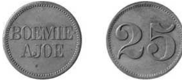
Boemie Ajoë, 25 (cents?) geelkoper, 20,5 mm Ø Uitgifteperiode: 1890-1900, Oost-Java – Malang Lansen/Wells: 58 Scholten: -- (schaars)