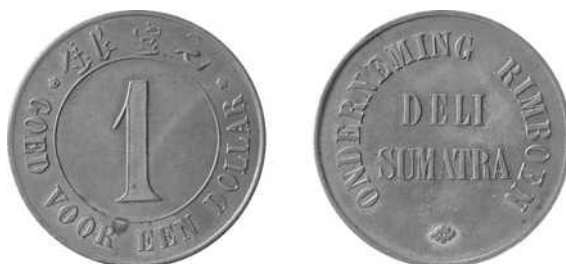
Onderneming Rimboen, 1 dollar roodkoper, 34 mm Ø Uitgifteperiode: ca. 1889-ca. 1904, oostkust Sumatra – Deli Lansen/Wells: 222 Scholten 1111 (zeldzaam)