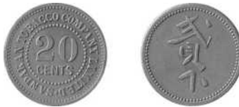
Sandakan Tobacco Company Limited, 20 cents roodkoper, 19 mm Ø proef Uitgifteperiode: voor 1896, Brits Noord-Borneo – Sandakan Lansen/Wells: 764 Scholten: -- (uiterst zeldzaam)