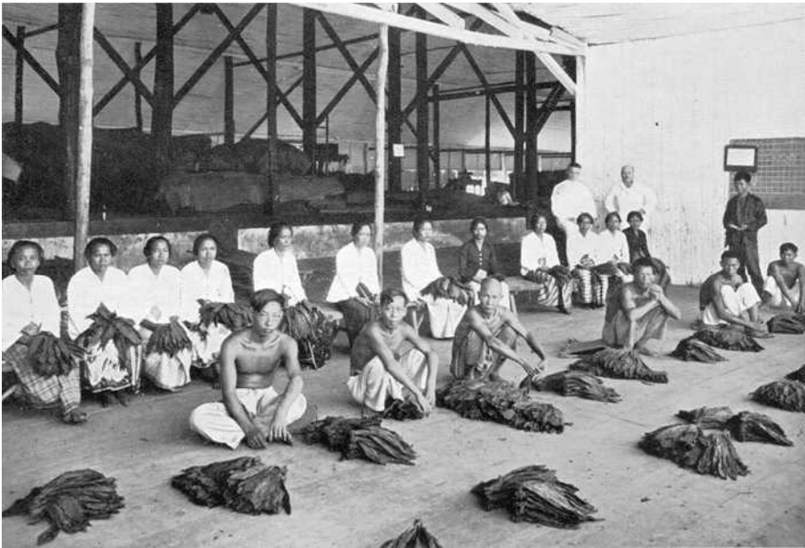
Ontvangen der tabak

Door de opkomst van de tabakscultuur aan de oostkust van Sumatra, omstreeks 1870 in Asahan, Langkat, Deli en Batoe Bahara, waren er nieuwe omloopgebieden ontstaan voor vreemde zilveren munten, waaronder allerlei verschillende soorten zilveren dollars.