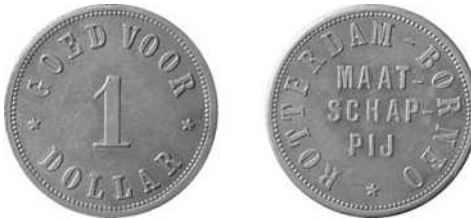
Rotterdam – Borneo Maatschappij, 1 dollar cupro-nikkel, 28 mm Ø Uitgifteperiode: voor 1896, Brits Noord-Borneo – Maruda Bay Lansen/Wells: 734 Scholten: 1119 (uiterst zeldzaam)