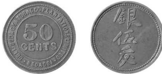
Deli Bedagei Tobacco Plantations Limited, 50 cents tin, 32,5 mm Ø Uitgifteperiode: ca. 1890-na 1896, oostkust Sumatra – Deli Lansen/Wells: 62 Scholten: 1048 (RRRR: van de hoogste zeldzaamheid)