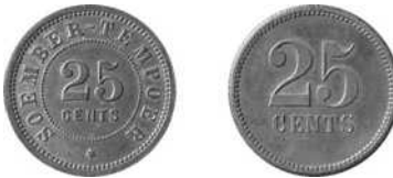
Soember Tempoer, 25 cents roodkoper, 20 mm Ø proef Uitgifteperiode: 1893-ca. 1910, Oost-Java – Malang Lansen/Wells: 366 Scholten: -- (uiterst zeldzaam)