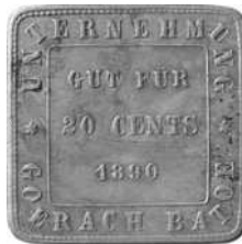
Unternehmung Goerach Batoe, 20 cents 1890 cupro-nikkel, 28 x 28 mm eenzijdig Uitgifteperiode: 1890-ca. 1897, oostkust Sumatra – Asahan Lansen/Wells: 89d Scholten: --