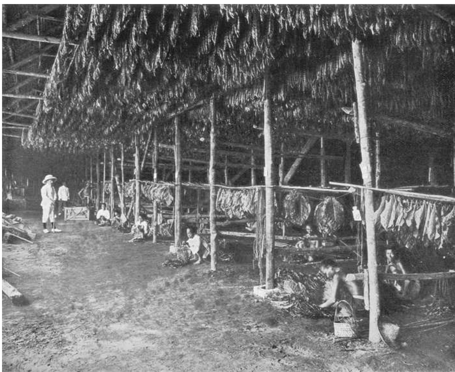
Aanrijgen van tabak in de droogschuur

De faam van de plantages aan de oostkust van Sumatra berust op de teelt van tabak, hoewel een groot aantal ondernemingen ook koffie, nootmuskaat, kokosnoten en verschillende soorten rubber produceerden. Rubber- en oliepalmen werden geplant in de gebieden op Oost-Sumatra waar geen hoge kwaliteitstabak geproduceerd kon worden.