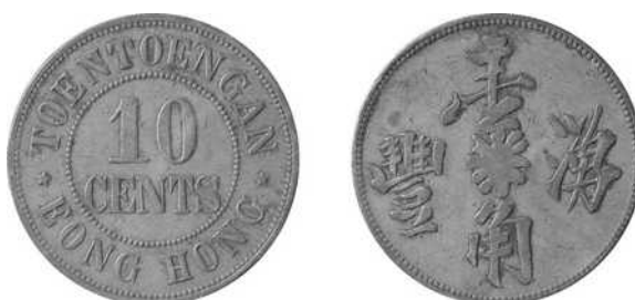
Toentoengan – Eong Hong, 10 cents geelkoper, 35 mm Ø Uitgifteperiode: voor 1896, oostkust Sumatra – Deli Lansen/Wells: 59 Scholten: -- (uiterst zeldzaam)