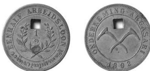
Onderneming Argasari, ½ arbeidsloon 1892 geelkoper, 30 mm Ø Uitgifteperiode: vanaf ca. 1889, West-Java – Bandoeng Lansen/Wells: 16 Scholten: 1019 (zeer zeldzaam)