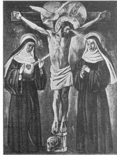
H. RITA en H. CLARA bidt voor ons.