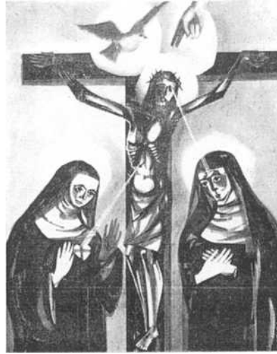
HEILIGE RITA, HEILIGE CLARA B. V. O.