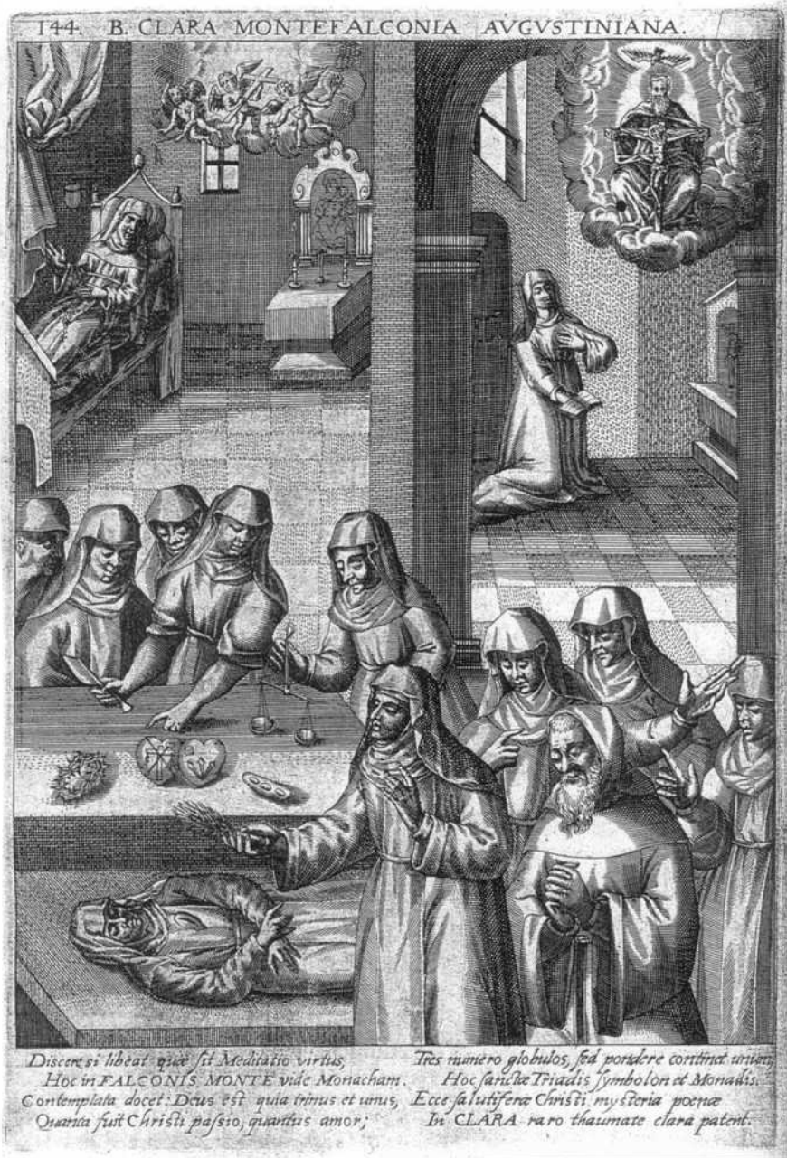
Afbeelding uit: Nicolaus CRUSENIUS, Monasticon Augustinianum , 1623, p. 144.