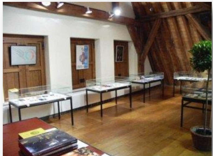
Tentoonstelling Belgische Medailles Belges 2003-2004.