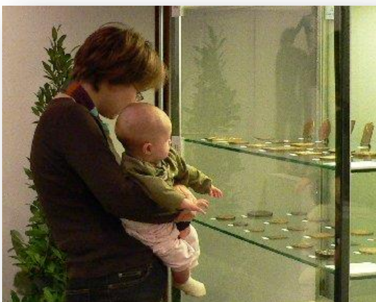
Een tentoonstelling die zelfs de jongsten kan boeien.