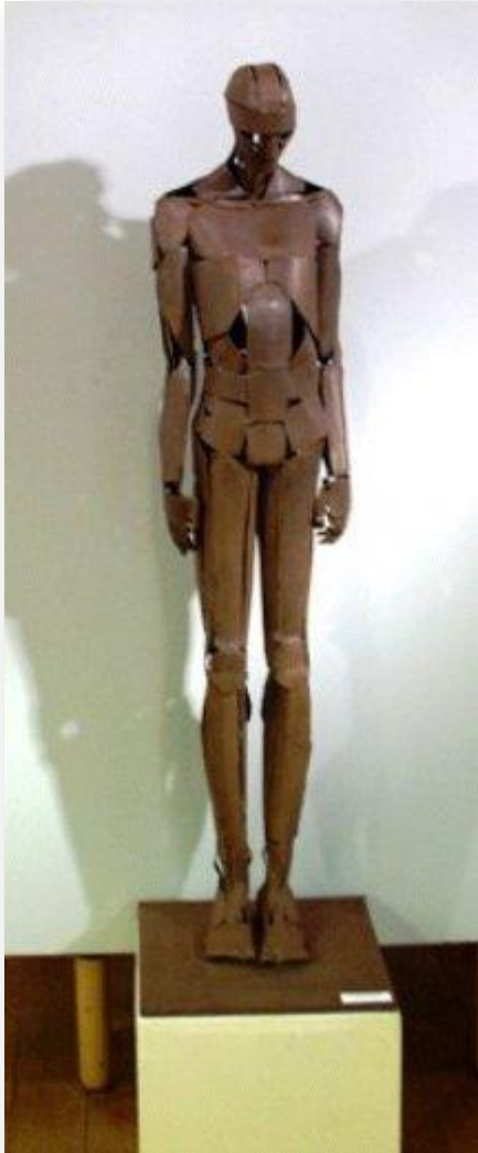
Staande figuur door Berth Van Poucke.