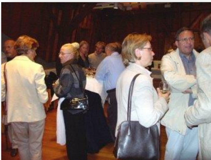
Nog enkele gasten in gesprek.