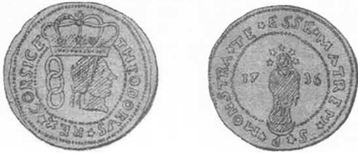
STUK VAN 1/2 SCUDO OP NAAM VAN THEODOOR

Hij dreef de stoutmoedigheid zover zijn troonsbestijging aan de senaat van Genua mede te delen.