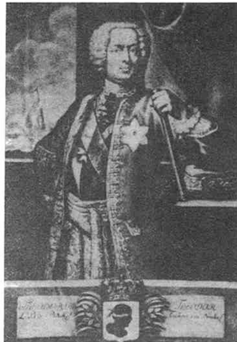
THEODOOR I KONING VAN CORSIKA

Intussentijd had hij in Spanje, naar men zegt, een lelijke en twist-zieke vrouw gehuwd die hem een dochter schonk. Maar hij verliet dit ongewenste gezelschap, nam haar juwelen mede en tegelijkertijd vond hij het geraadzaam de fondsen, die hem toevertrouwd waren