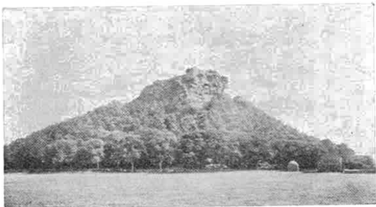
HEUVEL VAN BEESTON MET HET KASTEEL

Het kasteel van Beeston in het graafschap Cheshire, bevindt zich op een heuveltop van waaruit het een der drie toegangswegen naar Chester beheerst.