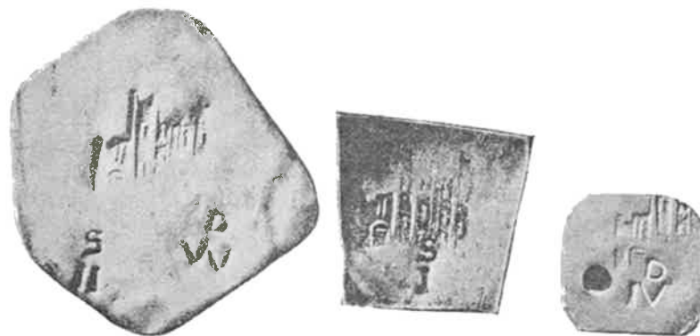
2 SHILLING EN 10 PENNY, 1 SHILLING, 4 PENNY

Dit kasteel, verdedigd door Sir Hugh Cholmondeley kapituleerde op 22 juli 1645 voor de troepen door Sir Mathew Bointon aangevoerd, na een belegering van 12 maanden. De omsingelde burcht was genoodzaakt haar bezit aan zilverwerk in kleine stukjes te verdelen. De meeste van deze stukjes zijn slechts op een zijde gestempeld