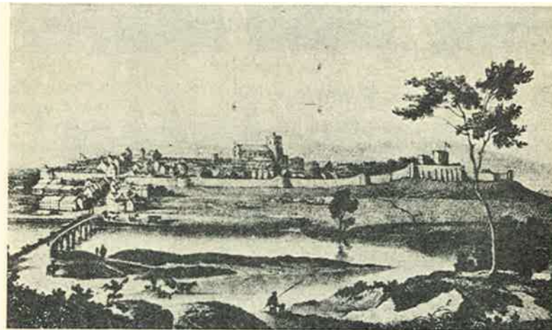
GEZICHT OP CARLISLE OMSTREEKS 1700

Gedurende de omsingeling werden er twee soorten noodmunten geslagen : stukken van drie en van één shilling. Bij benadering werden er 1000 munten van drie en 3460 munten van één shilling geslagen.