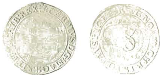
TEGENGESTEMPELDE SHILLING VAN CHARLES I

Eveneens wordt aan dit beleg een stuk toegewezen van 1 shilling van Charles I, tegengestempeld met een versierde letter S.