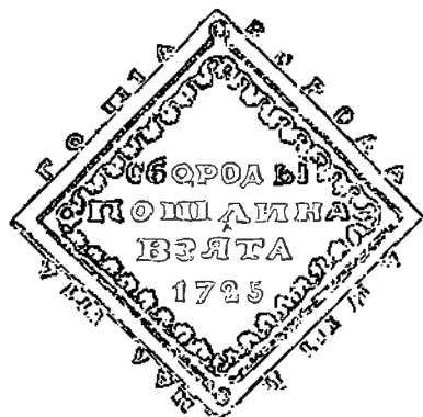
BAARDENGELD VAN 1725, VOLGENS W. HAWKINS

heid, hen te doen gevoelen, door de hindernissen medegebracht bij de meest onschuldige beoefening van de vrijheid door de eenvoudigste handelingen, dat de macht van de despoot onbegrensd is, dat er niets bestand is tegen zijn grillen en dat hij zo het hem bevalt zich evengoed kan amuseren met in een menselijk gelaat te hakken zoals men de taxisboom hakt in onze tuinen. M. P.