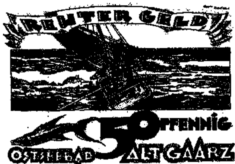
Afb. 7 : Alt-Gaarz : 50 Pfennig, keerzijde.