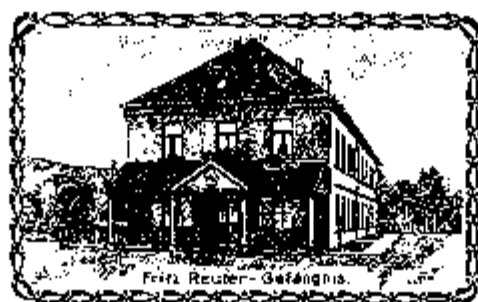
Afb. 4 : 25 Pfennig 10.7.1921 Sparkasse van Dömitz. Deze reeks Kleingeldscheine herinnert aan het verblijf van Reuter in de vesting aldaar (15).

In 1839 werd hij aan Mecklenburg uitgeleverd, waar hij nog tot 1840 in de vesting van de stad Dömitz werd vastgehouden (14).