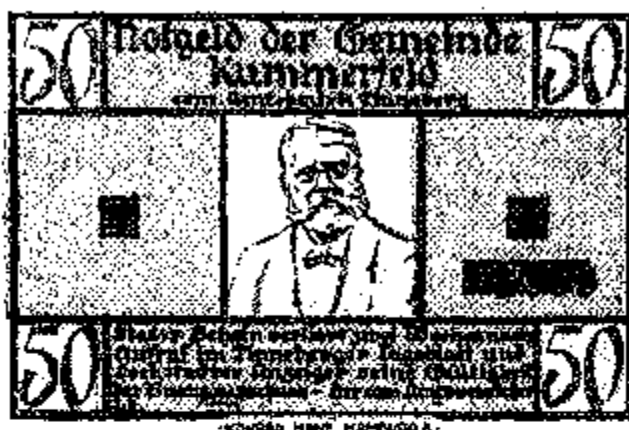
Afb. 16 : Kummerfeld : 50 Pfennig, voorzijde.

BRIEGER uit Hamburg. Destijds noemden de verzamelaars zulke uitgaven ook "Wuchergeld" of "Neppscheine".