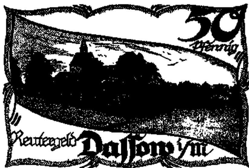
Afb. 8 : Dassow : 50 Pfennig, keerzijde.