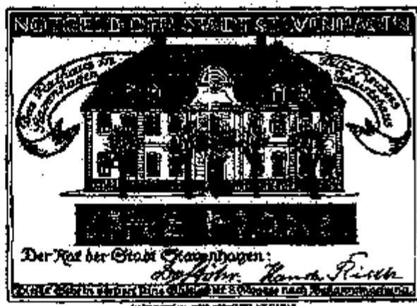
Afb. 1 : 50 Pfennig 1921 Staven - Afb. 2 : 1 Mark 1921 Stavenhagen- hagen. Portret van Reuter boven Raadhuis van Stavenhagen, waarin één van zijn verzen (11). Reuter het levenslicht zag (12).

Hij studeerde rechten te Rostock en te Jens. Daar trad hij toe tot de "Burschenschaft", een organisatie van hervormingsgezinde studenten. Nadat een lid van deze revolutionaire vereniging een politieke moord had gepleegd, werden al haar leden vervolgd. Fritz Reuter werd in 1833 te Berlijn aangehouden en wegens hoogverraad ter dood veroordeeld. Hij werd echter begenadigd en het vonnis werd in een gevangenisstraf van 30 jaar omgezet. Gedurende 6 jaar zat hij opgesloten in de vesting Silberberg in Schlesiën.