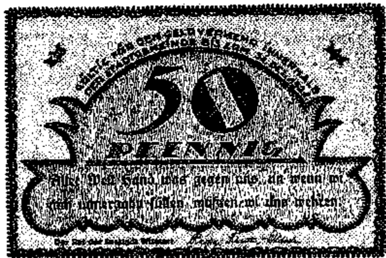
Afb. 15 : Wismar : 50 Pfennig, voorzijde.

Niet alleen de zeer gevarieerde en kunstvolle uitvoering van de biljetjes bepaalden hun succes, maar ook de citaten uit het werk van Fritz Reuter droegen daartoe bij. De amusante en wijsheidsbrengende teksten moeten niet alleen voor de verzamelaars van Mecklenburg, maar ook voor deze van heel de "Watarkant" (30), (waar ook platduits gesproken wordt) het nader beschouwen van elk der 210 biljetjes tot een genoegen maken. Voor niet-duitstaligen is het spijtig genoeg niet altijd mogelijk de gezegden, spreuken en verzen te begrijpen. Hier en daar valt dit toch wel mee. Zo staat er op het 10-Pfennigbiljetje van Sternberg "Aswer so ist dat sinmal in de Welt: wat Siner will dat kriggt hei nich un wat hei kriggt, dat will hei nich". Ook de kernachtige spreuk op het volgend biljetje van Wismar laat aan duidelijkheid niet te wensen