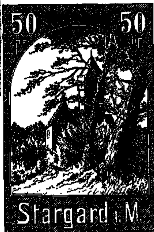
Afb. 10 : Stargard : 50 Pfennig, keerzijde.