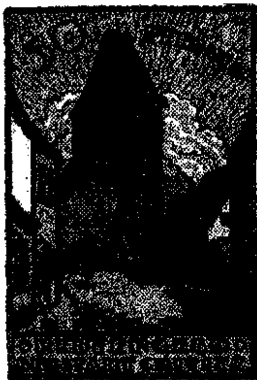
Afb. 9 : Crivitz : 50 Pfennig, keerzijde.