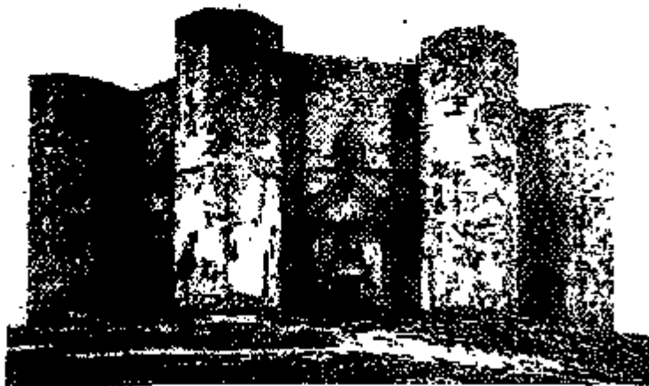
Castel del Monte Een residentie van Frederik II

In tegenstelling tot de adel van zijn tijd, die enkel naar belangstelling had voor oorlog en jacht, was Frederik leergierig. Hij verzamelde een kring van dichters en wetenschapsmensen rond zich. Te Napels stichtte hij de eerste werkelijke universiteit die staatssteun ontving en te Salerno hervondte hij de beroemde school voor geneeskunde, die openstond voor studenten van beide geslachten; in zijn grenzeloze objectiviteit liet hij toe dat vrijdenkers, monniken, rabbijnen en muselmanen naast elkaar onderwezen. Hij vaardigde wetten uit die aan de armen en de zwakken rechten toekenden en de plichten van de staat tegenover hen bepaalden; wettelijke voorschriften verdedigden weduwen en wezen. Nooit tevoren verbood een wetgeving wet zoveel kracht aan de rijken om de lasten van de gemeenschap op de armen af te schuiven. Zelfs de slaven hadden in zijn rijk het recht zich te verdedigen voor een rechtbank in plaats van, zoals overal elders, te zijn overgeleverd aan de willekeur van hun bezitters. Meer nog, hij schafte de slavernij af op zijn eigen gronden. Zij die het wilden konden betere landbouwtechnieken komen leren op modelhoeven. Hij liet vele waterputten graven in droge streken, die in vruchtbare tuinen werden omgetoverd.