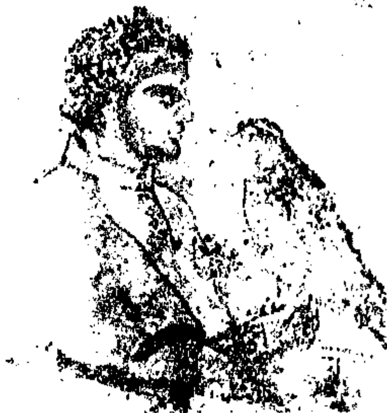
Frederik II Eigentijds portret uit De arte venandi

zonder geld. Wanneer hij voor de poorten van Constanz verscheen werd daar juist Otto verwacht en de koks waren reeds het feestmaal aan het bereiden. De bisschop aarzelde om Frederik binnen te laten doch de pauselijke gezant, die Frederik vergezelde, herinnerde er aan dat Otto zich in de kerken bevond. Frederik werd plechtig ingebaa'd en Otto, die drie uur later toekwam, stond voor gesloten stadspoorten. Velen zagen hierin de vinger Gods en Frederik won gestadig aanhang. Was Otto eerst in Constanz toegekomen dan was Frederik misschien nooit keizer geworden. Otto verloor steeds meer bondgenooten en in 1215 verdreef Aken zijn vertegenwoordigers zodat Frederik wettelijk in de hoofdstad van het rijk kon gekroond worden.