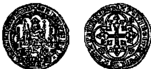
Afh. 7 Gouden schild Karel IV als keizer (1355-1378) Bohemen