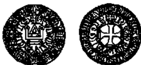
Afb. 2 Tourse groot Karel IV als keizer (1355 - 1378) Bohemen

In Bohemen sloeg hij echte Tourse groten, waarop men laatstge- noemde baaldenaar in combinatie met het typisch "châtel tournois" aantreft (27).