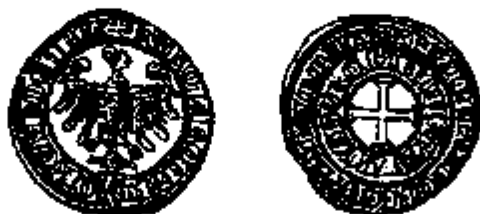
Afb. 1 Groot Karel IV (1346 - 1357) Luxemburg

Het zou om een Tournoe groot gaan, met op de ene zijde de gewapende keizer met het zwaard in de hand en op de andere een adelaar (24). Karel IV heeft elders wel degelijk groten geslagen, maar niet met dergelijke beeldenaars. Zowel in Bonn (25) als in Luxemburg (26) gaf hij groten met de adelaar uit, maar zijn beeltenis komt daar niet op voor; wel het typisch kort kruis omgeven door een dubbel omschrift.