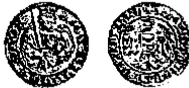
Afb. 5 Goudgulden Sigismund (1410 - 1437) Huesenberg

Geen van de bekende munttypes komt dus overeen met die welke Karel IV te Metz zou hebben gebruikt. Het spreekt boekdelen dat beeldenaars worden vermeld die de Roomse koningen pas in de 15de eeuw aanwendden. Met name is de koning met het zwaard een beeldenaar die op de gulden van Sigismund (1410-1437) voor het eerst voorkomt (32), bovendien is die gekoppeld aan de adelaar.