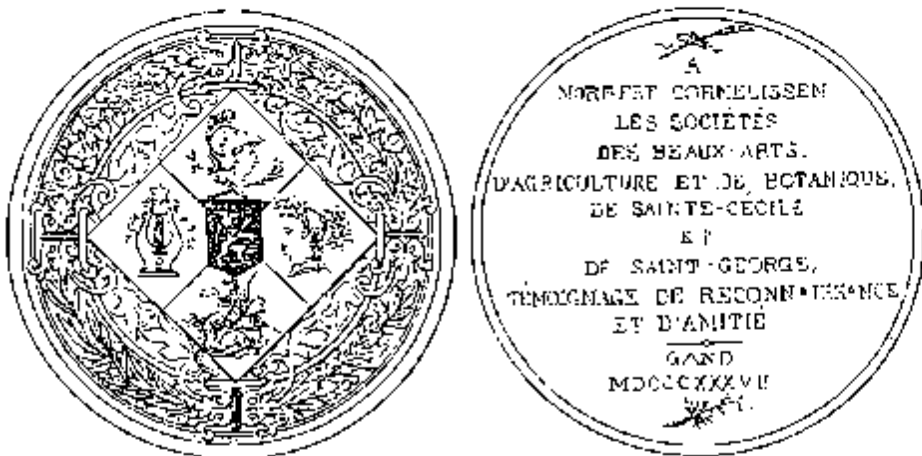
Lithografie van Van Peteghem

H. Kluyskens beschrijft het stuk in zijn studie over de penningen die aan beroemde personen werden opgedragen 32 , maar gleeed daarbij nog verder af: het jaartal is weergegeven in Arabische cijfers in plaats van in Romeinse en de diameter van het stuk is foutief (6 cm). Een decennium later nam J. L. Guioth een bespreking en een afbeelding van de medaille op in zijn standaardwerk over de Belgische penningen. Beide zijn merkwaardig! Guioth zegt zelf van de afbeelding: " Je l'ai fait lithographier sur une contre-épreuve faite par Ch. Onghena ". L.J. Van Peteghem, die de lithografie verzorgde, liet voor de voorzijde het spiegelbeeld van de tegendruk ongemoeid, maar draaide (en verdraaide!) wel de signatuur (CH S - ONGHENA - SCT).