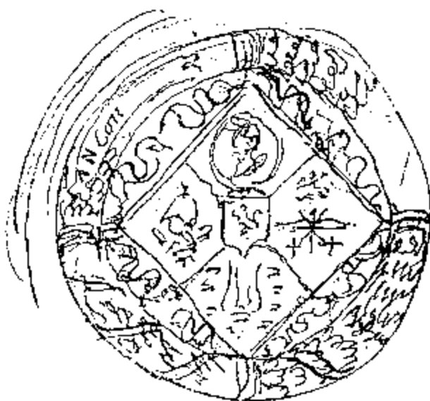
Schets van Louis Roelandt

De ruwe inkschets heeft een diameter van circa 63 mm. Opvallende afwijkingen van de definitieve versie zijn de kruisboog met twee gekruiste pijlen en twee Griekse kruisen onder Sint Joris die de draak velt, en de uitwerking van de kroon (met een omwikkeld lint en een inscriptie).