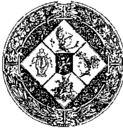
Tegenafdruk van de medaille

In 1838 publiceerde de Messenger des Sciences et des Arts een bondig verslag zonder afbeelding, maar met de keerzijdeinscriptie zoals in voorgaande publikatie 30 . Hetzelfde gebeurde in het Précis historique de la Société Royale des Beaux-Arts et de Littérature de Gand , dat in 1845 in de Annales van deze vereniging verscheen 31 .