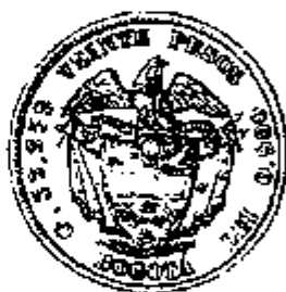
Confederacion Granadina 20 Pesos 1859