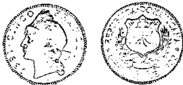
5 Francos 1891

Bank - geopteerd voor het systeem van de franco van 5 gram zilver met een gehalte van 0.900. Dit niettegenstaande het feit dat de bevolking gewend was aan het rekenen in pesos . In Parijs werd voor een bedrag van nagenoeg 1 miljoen francos , nieuwe stukken (van 5 centesimos tot 5 francos ) vervaardigd. Om het gebruik ervan te bevorderen werd op 6 augustus 1891 bij decreet verordend dat minstens 1/10 van elke betaling met deze nieuwe munten moest geschieden. Dit mocht echter niet baten, want de nieuwe denominaties bleven onpopulair.