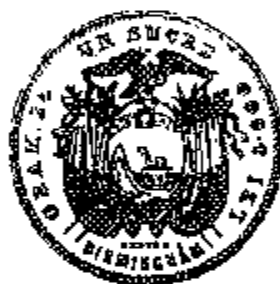
1 Sucre 1895

De wet voorzag ook gouden munten, waarbij de waardeverhouding tussen het goud en zilver werd vastgelegd op 15 1/2. Er werden echter nooit goudstukken aangemunt, zodat de wisselkoers van de sucre in de praktijk gekoppeld was aan de steeds maar dalende zilverprijs. Daarom werd de munteenheid in 1898 gheredefinieerd en vastgelegd op 1/10 van het pound sterling , en werd de aanmuntning van zilverstukken stopgezet. In totaal werd in de periode van 1884 tot 1897 voor circa 4,8 miljoen sucre s zilvergeld geslagen, waarvan ongeveer 2,65 miljoen stukken van 1 sucre .