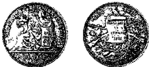
1 Peso 1879

Toen in 1871 een succesvolle revolte tegen diens regering plaatsvond, haastte zijn opvolger zich dan ook om de vroegere toestand gedeeltelijk te herstellen. Het decreet van 9 december 1871 voerde opnieuw de onderverdeling in 8 reales in, en verhoogde het gewicht van de peso tot 25,40 gram. Allicht om de terugkeer naar de "goede oude tijd" extra te accentueren, werden de munten ook van een nieuwe beeldenaar voorzien : een zittende vrouw houdt een hoorn des overvloeds vast (met graan, koffie, suiker en vanille, de vier belangrijkste exportprodukten van Guatemala) en leunt op een kolom met de datum 30 juni 1871 (de dag waarop de vorige president was verdreven, en die dus gold als het begin van nieuwe en betere tijden). Het valt echter te betwijfelen of de gedecreteerde gewichtshoging ook in de praktijk werd doorgevoerd. De weinige pesos die in de jaren 1872-1889 door het lokale muntatelier werden geslagen, blijken alle minder dan 25,40 gram te wegen (en doorgaans zelfs iets minder dan 25 gram).