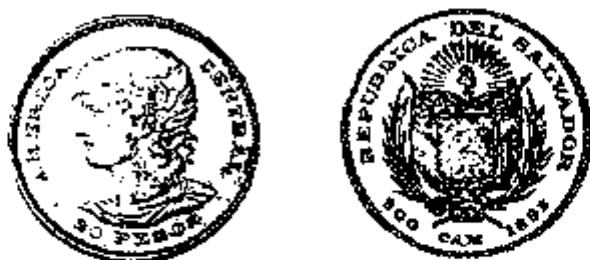
20 Pesos 1892

Er werd een mooie reeks gouden en zilveren munten vervaardigd, al was de productie van goudstukken eerder symbolisch (in totaal slechts voor circa 11.500 pesos).