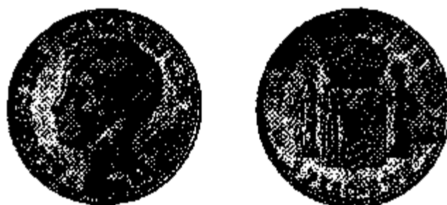
Alfonso XIII 1 Peso 1895

In 1895-1896 werden voor ongeveer 9,5 miljoen pesos stukken van 5, 10, 20 en 40 centavos en van 1 peso uitgegeven, maar deze waren geen lang leven beschoren. Vanaf 1898 kwam Puerto-Rico immers onder het bestuur van de Verenigde Staten, na de nederlaag van Spanje in de Spaans-Amerikaanse oorlog. Via een besluit van 28 december 1898 bepaalde de Amerikaanse administratie dat deze stukken vanaf 1 januari 1899 geleidelijk uit de omloop zouden worden genomen, en voorlopig zouden circuleren tegen een wisselkoers van 1 peso = 0,80 dollar. Dit is blijkbaar met Amerikaanse grondigheid gebeurd, want deze stukken zijn heel wat moeilijker te vinden dan hun slagaantallen zouden doen vermoeden.