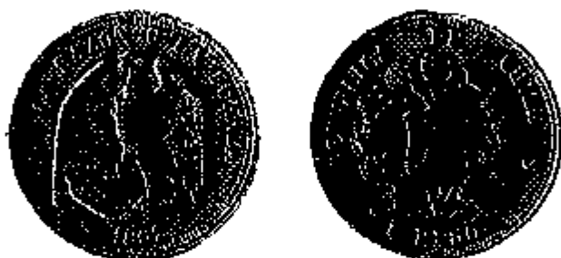
1 Peso 1867

De ontdekking van belangrijke goudmijnen in de jaren 1850 deed de zilverprijs echter stijgen, en daarom werd in 1860 het fijngewicht aan zilver in de pasmunt verminderd (twee jaar voor Italië een gelijkaardige maatregel trof, wat de aanleiding vormde voor de oprichting van de Latijnse Muntunie). Dit gebeurde door bij een ongewijzigd gehalte van 900 ‰ het gewicht te verminderen. In 1867 werden de karakteristieken van de pasmunt opnieuw gewijzigd : het gewicht werd verhoogd en het gehalte vermindert tot 835 ‰ (hetgeen ook door de twee jaar eerder opgerichte Latijnse Muntunie was gedaan).