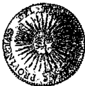
Provincia Rio de la Plata 8 Escudos 1832