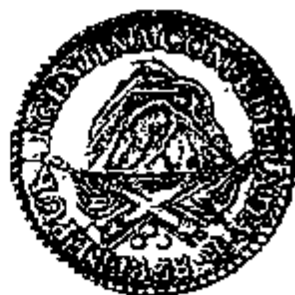
Provincia La Rioja 8 Reales 1838

De wet van 8 november 1881 bracht hierin verandering. De verschillende provincies verloren het recht om eigen stukken uit te geven, hetwelk nu werd voorbehouden aan de federale overheid. Bovendien voerde ze een nieuw monetair systeem in, gebaseerd op een zilveren peso met een massa van 25 g en een gehalte van 900 ‰, en voorzag ze ook de uitgifte van een gouden argentino (ter waarde van 5 pesos), waarbij de waardeverhouding tussen goud en zilver werd vastgelegd op 15 1/2. De meeste munten werden geslagen door de Munt van Buenos Aires, maar in een poging om toenadering te vinden tot de Latijnse Muntunie werd een beroep gedaan op de Munt van Parijs (en de Franse graveur Oudinot) voor het vervaardigen van de stempels. Tot een aansluiting bij de Latijnse Muntunie is het echter niet gekomen.