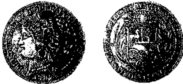
5 Pesetas 1882 Ayacucho

verslagen, en een deel van Peru (met de hoofdstad Lima) werd enkele jaren door het Chileens leger bezet. Tijdens dit conflict voerde Peru een nieuw muntstelsel in, nog steeds gebaseerd op het systeem van germinat , maar met een peseta van 5 gram als eenheid. Het atelier van Lima sloeg stukken van 5 en 1 peseta in 1880, in 1881 en 1882, toen Lima door de Chilenen was bezet, werd de productie verdergezet te Ayacucho in de Andes, terwijl in Lima opnieuw de vertrouwde soles werden aangemaakt.