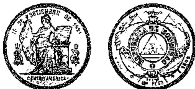
1 Peso 1889

boek van de grondwet ondersteunt dat op een voetstuk rust. De rond een drietand gekronkelde dolfinen links en rechts in het veld symboliseren de Stille en de Atlantische Oceaan, zoals blijkt uit de letter P ( Pacific ) op de linkse dolfin en de letter A ( Atlantic ) op de rechtse. Op vele munten zijn deze letters echter onherkenbaar, omdat de munt van Comayagua in primitieve omstandigheden moest werken en dikwijls versleten matrijzen herbruikte na ze gedeeltelijk gehergraveerd te hebben. Uiteindelijk konden de details van de beeldenaars zo goed als onherkenbaar worden. Het is bijgevolg zeer moeilijk deze stukken in mooie kwaliteit te vinden, want zelfs deze die pas uit de pers kwamen vertoonden dikwijls maar weinig reliëf.