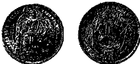
20 Soles 1863

Peru maakte zich in 1821 los van Spanje, maar behield de eerste 40 jaar van zijn onafhankelijkheid het muntstelsel van de vroegere kolonisator. Op 14 februari 1863 werd het vervangen door het systeem van germinal . Als nieuwe munteenheid werd de sol ingevoerd. Deze stemde overeen met 25 gram zilver van 900 ‰. Goudstukken (met een waardeverhouding van 15 1/2 t.o.v. het zilver) werden enkel in 1863 geslagen.