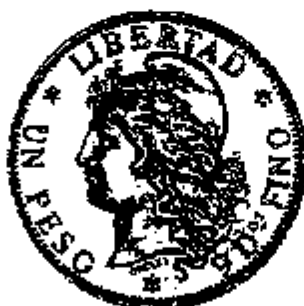
1 Peso 1882

De wet van 8 november 1881 bracht hierin verandering. De verschillende provincies verloren het recht om eigen stukken uit te geven, hetwelk nu werd voorbehouden aan de federale overheid. Bovendien voerde ze een nieuw monetair systeem in, gebaseerd op een zilveren peso met een massa van 25 g en een gehalte van 900 ‰, en voorzag ze ook de uitgifte van een gouden argentino (ter waarde van 5 pesos), waarbij de waardeverhouding tussen goud en zilver werd vastgelegd op 15 1/2. De meeste munten werden geslagen door de Munt van Buenos Aires, maar in een poging om toenadering te vinden tot de Latijnse Muntunie werd een beroep gedaan op de Munt van Parijs (en de Franse graveur Oudinot) voor het vervaardigen van de stempels. Tot een aansluiting bij de Latijnse Muntunie is het echter niet gekomen.