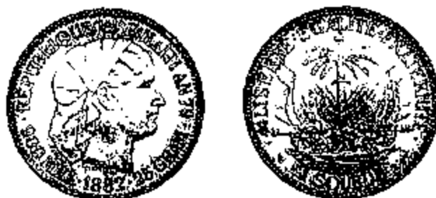
1 Gourde 1895

De wet van 28 september 1880 voerde in Haïti het systeem van germinal in. Het was gebaseerd op de gourde , een zilverstuk van 25 gram en 0.900 fijn. De naam van deze munteenheid zou zijn afgeleid van het Spaanse gordo (wat dik, zwaar betekent), een bijnaam van de zware pesos. De regering werd gemachtigd om onderhandelingen aan te knopen met de Latijnse Muntunie met het oog op een aansluiting, maar zover is het nooit gekomen. De wet voorzag ook in de uitgifte van goudstukken, met een waardeverhouding tussen goud en zilver van 15 1/2, maar deze zijn nooit geslagen. Wel werden tussen 1880 en 1895 in de Munt van Parijs voor ongeveer 4,5 miljoen gourdes zilverstukken geslagen.