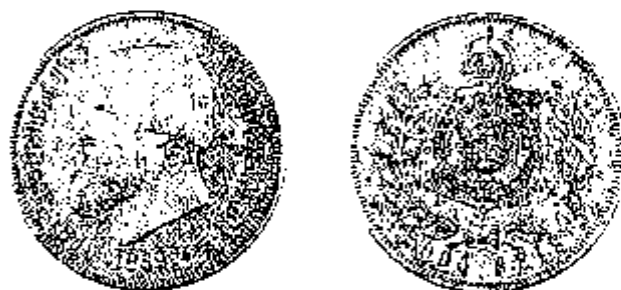
Pedro II 2.000 Reis 1868

Naar aanleiding van de Internationale Monetaire Conferentie van 1867 te Parijs, waar onder meer een pleidooi werd gehouden voor de veralgaming van het gebruik van het decimaal stelsel van maten en gewichten en voor een universeel muntsysteem, gebaseerd op de principes van dat van germinal , wijzigde Brazilië bij decreet van 20 september 1867 het gewicht en het gehalte van zijn zilverstukken. Het standaardstuk van 2 milreis stemde voortaan exact overeen met een stuk van 5 francs (d.w.z. 25 g met een gehalte van 900 ‰) in de praktijk betekende dit dat elk stuk ongeveer 3,7 % minder zilver bevatte.