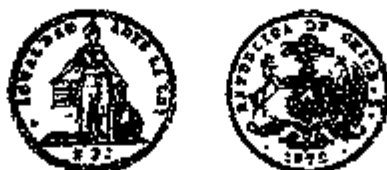
5 Pesos 1872

De alignering op het germinaal -systeem van de Latijnse Muntunie was evenwel niet volledig, aangezien de wettelijke waardeverhouding tussen goud en zilver circa 16,4 bedroeg in plaats van 15 1/2. Deze overwaardering van het goud kon evenwel niet beletten dat de aamunting ervan sinds het midden van de jaren 1870 sterk terugviel.