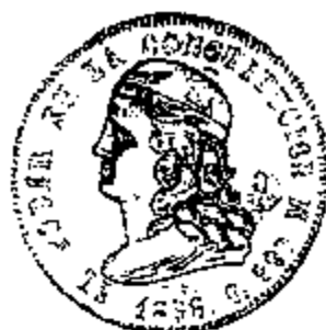
5 Francos 1858

Het stelsel van germinal werd enkele decennia later toch ingevoerd via de wet van 1 april 1884. De nieuwe munteenheid, die overeenstemde met 25 gram zilver van 0.900 fijn, werd sucre genoemd naar generaal Antonio José de Sucre, die een voorname rol had gespeeld in de onafhankelijkheidsoorlog tegen Spanje.