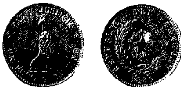
1 Peso 1889

In de daaropvolgende jaren gaf de regering grote hoeveelheden bankbiljetten uit, waardoor de waarde van de peso voortdurend afnam. In 1914 werd een stabilisatiepoging ondernomen, waarbij de waarde van de papieren peso werd vastgelegd op 1/16 van de vroegere waarde. Dit niveau kon echter niet worden gehandhaafd. Pas in 1923 kon de peso gestabiliseerd worden, op ongeveer 1/43 van de vroegere waarde.