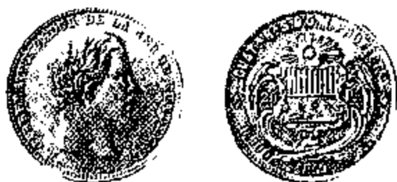
20 Pesos 1859

In dit nieuw muntstelsel verminderde de intrinsieke waarde van de peso met circa 8,6 % , en werd overgestapt van een onderverdeling volgens het 8-talig (1 peso = 8 reales ) naar het decimaal stelsel. Deze wijzigingen werden door de bevolking zeer slecht ontvangen, en droegen in grote mate bij tot de onpopulariteit van de toenmalige president.