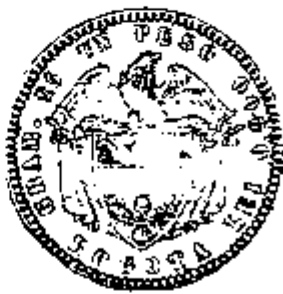
Estados Unidos de Colombia 1 Peso 1868