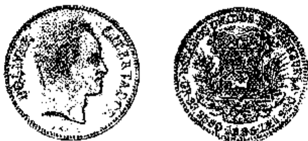
100 Bolívares 1886

genoemd (naar de muntmeester die het eerste exemplaar sloeg bij de plechtige opening van het munthof op 16 oktober 1886). Al snel bleek echter dat de regering nogal lichtzinnig tewerk was gegaan. De muntwet van 2 juni 1887 beperkte de aanmunting in zilver immers tot 5 bolívares per inwoner. Dit kwam neer op ongeveer 11 miljoen bolívares , hetzij nog geen 3 jaar aanmunten aan het contractueel afgesproken ritme van 4 miljoen bolívares per jaar. Ook de aanmunting voor rekening van de lokale goudmijnen bleef ver onder de verwachtingen, zodat het snel duidelijk werd dat de contractuele verplichtingen niet konden worden gehonoreerd. Het Frans consortium, dat belangrijke bedragen had geïnvesteerd, eiste en verkreeg een forse schadevergoeding, en het atelier werd in 1890 ontmanteld. Sindsdien werd weer een beroep gedaan op buitenlandse munthoven, vooral dat van Parijs. Op dat moment was een eventuele aansluiting van Venezuela bij de Latijnse Muntunie echter niet meer aan de orde.