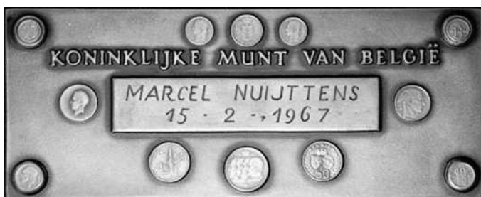
Munthof gelegen op het grondgebied van Sint-Gillis in gebruik van 1887 tot 1987

Toen de koninklijke Munt zich nog op haar vroegere locatie bevond, bracht de afdeling Numismatica Zuidwest-Vlaanderen op 15 februari 1967 een werkbezoek. Zeer opmerkelijk was daar dat allerlei slagmateriaal her en der verspreid lag, zoals op