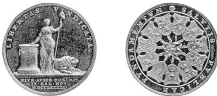
Medaille “Ons land bevrijd van de Oostenrijkse heerschappij”, A. de Witte (Van Berckel) nr. 116

Bibliografie: A. DE WITTE, Le graveur Théodore Victor van Berckel, Essai d'un catalogue de son œuvre , Louvain 1909.