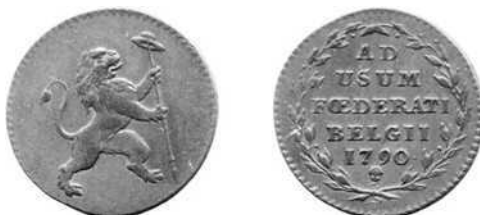
Dubbel oord, Van Keymeulen nr. 244

Bibliografie: Cat. pat. en mat. Deel I nr. 94