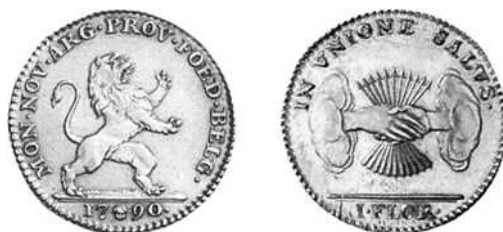
Florijn type 1, Van Keymeulen nr. 240

Bibliografie: Cat. pat. en mat. Deel I nr. 93