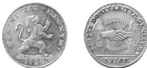
Florijn type 2, Van Keymeulen nr. 241