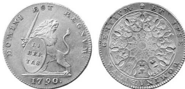
Zilveren leeuw, Van Keymeulen nr. 239

Bibliografie: Cat. pat. en mat. Deel I nr. 92