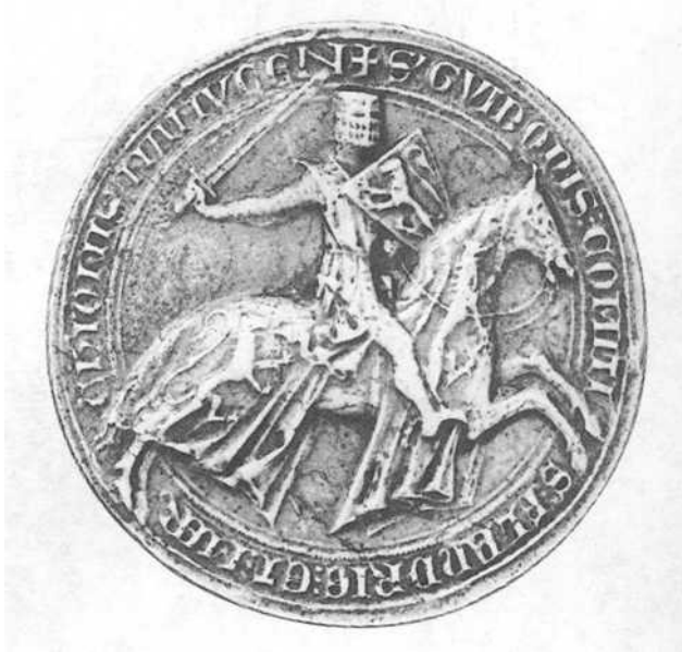
Zegel van Gwijde van Dampierre, met één leeuw in het wapenschild en twee leeuwen op de mantel van het paard. Brussel, Algemeen Rijksarchief.