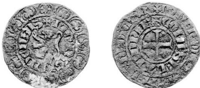
Groot met de leeuw zonder naam van de graaf. Gaillard 200, schaal ½

Er werden in 2002 ook Vlaamse munten verhandeld die het etiket “uiterst zeldzaam” waardig zijn. Een mooi voorbeeld daarvan is het stuk dat het onderwerp van dit artikel uitmaakt: de fameuze groot met leeuw maar zonder naam van de graaf, alom gekend als “den Gaillard 200”. Het hieronder afgebeelde exemplaar werd geveild door Jean Elsen N.V. te Brussel op 14 december 2002, veiling 72, lot nr. 1690.