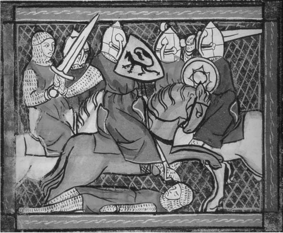
Ridders in gevecht. Het wapenschild met zwarte klimmende leeuw in het midden is dat van Vlaanderen. Illustratie van de vechtkunst in "Li ars damour, de vertu et de boneureté", Vlaanderen, eind 13 de eeuw. Brussel, Koninklijke Bibliotheek van België, Ms. 9543, fol. 121.

Op 20 september 1303 werd in een klooster in de omgeving van l'Ecluse/Dowaai (Douai) een wapenstilstandsverdrag ondertekend, dat aanvankelijk geldig was tot 17 mei 1304, maar later werd verlengd tot 24 juni 1304. In dat verdrag werd uitdrukkelijk bepaald dat zowel Gwijde van Dampierre alsook zijn zoon Willem van Crèvecœur (de andere zoon, Robrecht van Béthune, dus niet) tijdelijk in vrijheid werden gesteld teneinde de wapenstilstand om te zetten in een vredesverdrag met Frankrijk. In de praktijk werden die vredesonderhandelingen geleid door zoon Willem. Uiteindelijk werd er terug naar de wapens gegrepen, wat resulteerde in de beter gekende slag bij de Pevelenberg op 18 augustus 1304.