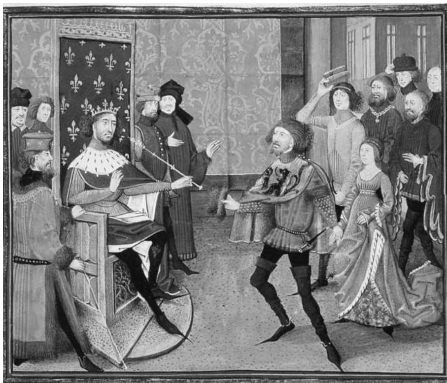
Filips IV de Schone, omringd door topambtenaren, ontvangt graaf Gwijde van Dampierre (met op zijn borst de Vlaamse Leeuw). Achter de graaf staat zijn dochter Filippina, die door de koning (haar dooppeter) in Parijs gevangen was gezet. Miniatuur, 15 de eeuw. Parijs, Bibliothèque de l’Arsenal, Ms. 6328, fol. 2.

De vader van graaf Robrecht III van Béthune was Gwijde van Dampierre. In zijn hoedanigheid van graaf van Vlaanderen (1278-1305) was deze vorst niet onafgebroken bij machte om te regeren. Hij werd door de Franse koning Filips de Schone (1285-1314) een eerste keer gevangengenomen, namelijk van 28 september 1294 tot eind februari 1295, naar aanleiding van het voorgenomen huwelijk van zijn dochter Filippina met de Engelse kroonprins, de latere Edward II. Tijdens die relatief korte afwezigheid werd zijn zoon Robrecht van Béthune als regent aangewezen.