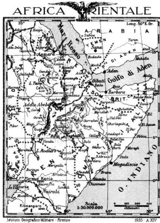
Italiaans Oost-Afrika ten tijde van zijn grootste expansie (1936).

Italië breidde haar bezittingen voortdurend uit op het Afrikaanse continent. Zo behoorden Eritrea en Libië ook tot het Italiaanse rijk en werd de droom van Italië om de ganse Hoorn van Afrika te bezetten voor een korte periode gerealiseerd door de beruchte bezetting van Abyssinië (Ethiopië) in 1936. Aan de vooravond van de