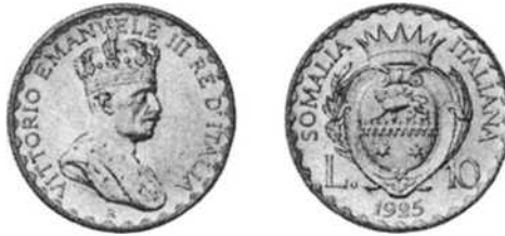
10 lire Italiaans Somaliland 1925, koning Victor Emanuel III.

Speciaal voor de kolonie voorzag hetzelfde decreet de aanmuntning van twee zilveren munten van 5 en 10 lire. Deze aanmuntning viel samen met de overname en inlijving van de noordelijke sultanaten van Obbia en de Mijjertein en was waarschijnlijk de reden van deze aanmuntning. Beide munten zijn identiek qua design 7 . De munten zijn geslagen uit 0,835 zilver en wegen 6,00 g en 12,00 g met een oplage van 400.000 en 100.000 voor de 5 lire en de 10 lire. Door het feit dat de gelijkaardige metropolitaanse exemplaren minder zilver bevatten, kwamen deze munten niet vaak voor in omloop en vindt men ze dan ook vaak in prachtige toestand.