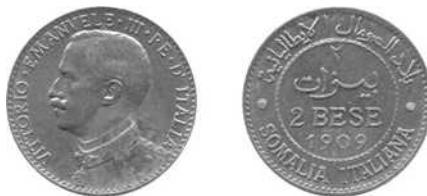
2 besas Italiaans Somaliland 1909, koning Victor Emanuel III.

De rupie haalde het tegenover de thaler. De laatste was al ingeburgerd in Somalië en verspreid over de ganse regio (Oost-Afrika en Arabië). Om de introductie te vergemakkelijken werd er een munt opgericht in Mogadishu. Zes denominaties werden geslagen te Rome: bronzen 1, 2 en 4 besas, en zilveren \frac{1}{4} , \frac{1}{2} en 1 rupie. De bronzen munten werden eerst geslagen in 1909, met de buste in profiel van de koning Victor Emanuel III in militair uniform \frac{5}{6} .