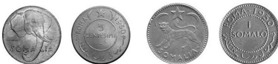
5 centesimi 1950 en 1 somalo 1950, Italiaans mandaat over Somalië.

Na een kwart eeuw van hiaat wat het muntwezen betreft in dit gebied werd door de Italiaanse regering \frac{8}{100} de somalo geïntroduceerd \frac{9}{100} , dewelke geconverteerd werd in somalishilling in 1962, na de onafhankelijkheid. Vijf verschillende munten werden in omloop gebracht: 1, 5 en 10 centesimi in brons en 50 centesimi en 1 somalo in zilver (0,250 fijn wegend 3,80 g en 7,60 g). Op de bronzen munten staat de kop van een olifant afgebeeld met het woord SOMALIA eronder. Op de keerzijde kan men het woord ROMA in het Latijns en Arabisch schrift lezen, de muntwaarde en de datum in AD1950 en AH1369. Op de zilveren munten staat een luipaard afgebeeld. Deze munten werden snel aanvaard door de bevolking wegens het grote gebrek aan pasmunten dankzij de groeiende economie. Deze munten bleven tot ver na Somalië's onafhankelijkheid, 1 juli 1960, in omloop. De somalomuntstukken werden pas vervangen in 1967 door een nieuwe scellino (somalishilling).