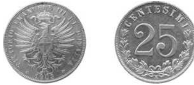
25 centesimi 1903, Italië

De oude “besas” bleven in omloop en de nieuwe werden aanvaard als 1 en 2 besas, respectievelijk.