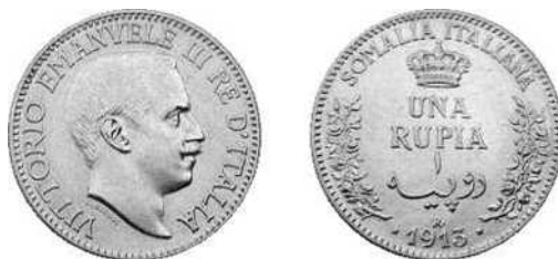
1 rupie Italiaans Somaliland 1913, koning Victor Emanuel III.

De zilveren munten werden geslagen in 1910 met een wat ingekorte buste 6/. Op de munten kan men duidelijk de kroon van het koninkrijk zien en de legende “Somalia Italiana” aangevuld met de waarde aanduiding zowel in het Arabisch als in het Italiaans en het muntmerk “R” boven de datum. De rupie had een zilveragehalte van 0,917 en woog 11,66 g wat exact overeenkwam met de standaarden in gebruik voor India en de andere kolonies, dit was met de bedoeling dat deze munt zonder problemen werd aanvaard door de lokale bevolking. Het gevolg van deze succesintroductie was de uitdrijving van de thaler in de belangrijke havens, hoewel de Somali's de thaler superieur achtten.