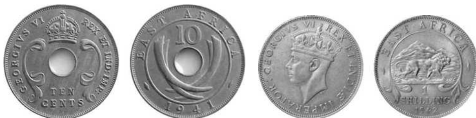
10 cent 1941 en 1 shilling 1942, Brits Oost-Afrika.

Berbera naar het binnenlandse Hargeysa. De Britten bleven meester van dit gebied tot in 1949, wanneer de VN het beheer van het gebied terug aan Italië overgaf, met als doel het land te begeleiden naar de onafhankelijkheid. Tijdens deze periode werden er geen speciale munten geslagen voor Somaliland en werd het Brits Oost-Afrikaans geld in omloop gebracht.