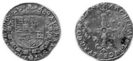
Stoter of 1/8 gulden van Albrecht en Isabella atelier Brugge

Vz. Het gekroond wapenschild van de aartshertogen met er rond de ketting en het juweel van het guldenvlies