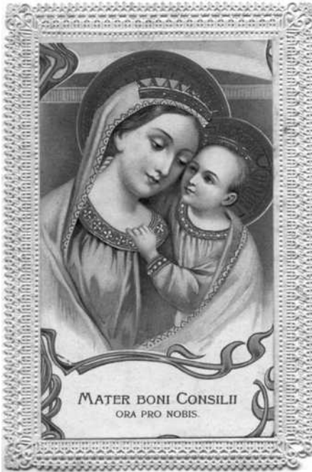
Kantprentje van Moeder van Goede Raad, 1880 (11,7 x 7,7 cm)