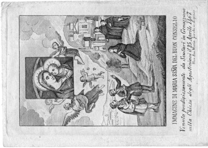
Onze-Lieve-Vrouw van Goede Raad, Italiaans prentje (ets), 19 de eeuw (11 x 7,7 cm)