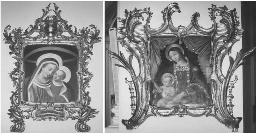
Moeder van Goede Raad (links, met baroklijst) en Onze-Lieve-Vrouw van de Riem van Troost (rechts, met rococolijst), olie op doek, Augustinuskerk Würzburg