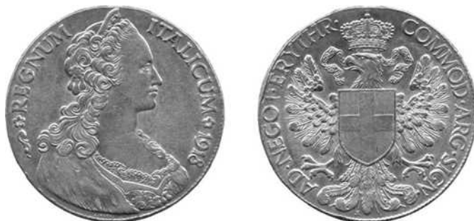
Tallero, Erytrea 1918

Een andere merkwaardigheid is dat het succes van de thaler in Erytrea en Ethiopië ertoe geleid heeft de Italiaanse regering een eigen thaler (de tallero) in omloop te brengen, hoewel zonder veel succes.