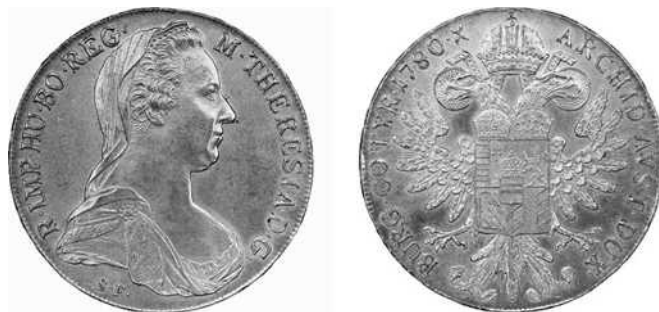
Maria-Theresiathaler, type 1780

Maria-Theresia kwam aan het hoofd van de Habsburgse familie in 1740 na de dood van haar vader, keizer Karel VI. Zij regeerde van 1740 tot 1780 en was de laatste keizerin van het Heilige Roomse Rijk. Het rijk van de Habsburgers omvatte in die tijd niet alleen Centraal-Europa, maar ook nog de Zuidelijke Nederlanden, die ze hebben kunnen behouden ondanks de Spaanse successieoorlog in het begin van de 18 de eeuw.