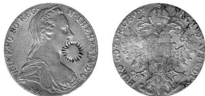
Ethiopië (jaren 1930)

Uiteindelijk vermelden we Ethiopië (Abyssinië), het thalers meest succesvol gebied in Afrika.