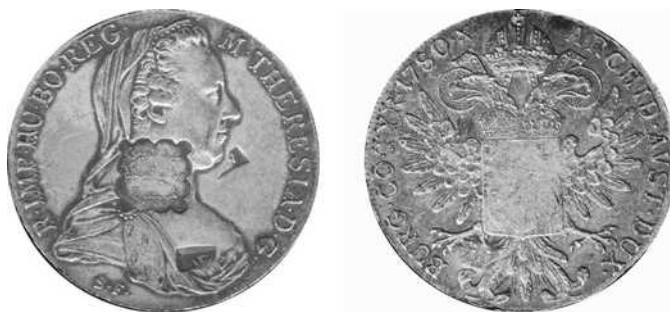
Djibouti (jaren 1940), extra Arabisch "830" teken

Tegenstempels op oudere thalertypes bestaan. Er moet opgemerkt worden dat de tegenstempels afkomstig uit Obock en Djibouti ook bestaan op Brits Indische rupies en halve rupies.