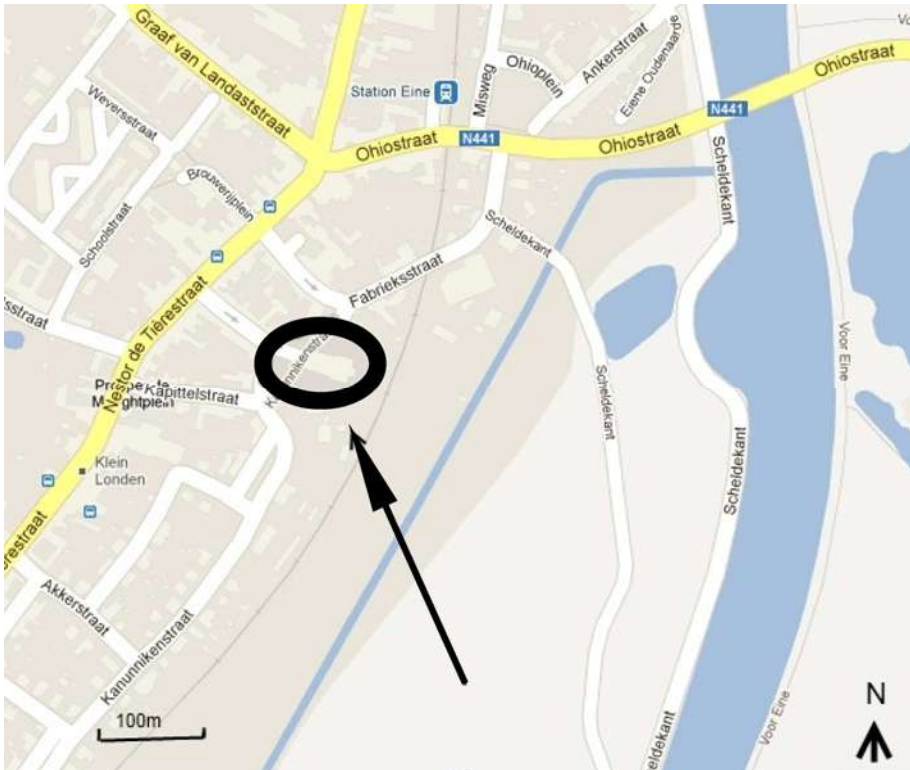
Fig. 1 – Situering van de vindplaats

T IJDENS HET INSTALLEREN VAN NUTSVOORZIENINGEN OP HET DORPSPLEIN van Eine in 2008 werd een pakket grond uitgegraven en afgevoerd [1] . Deze bulk werd door Jean-Pierre Parent met een metaaldetector doorzocht. Hierbij kwam een belangrijke hoeveelheid metalen voorwerpen aan het licht, waaronder een tachtigtal munten. Dit numismatisch materiaal biedt een staalkaart van het lokaal muntgebruik – en vooral van de pasmunt – van het midden van de 11 de eeuw tot de 20 ste eeuw.