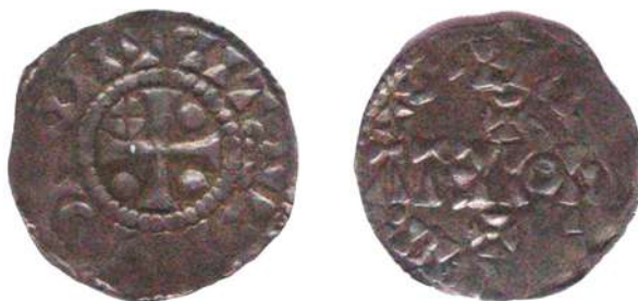
Fig. 5 – Dbg. 142a (schaal 200%)

Voor wat recente veilingen betreft, hebben we weet van slechts één enkel stuk dat op 18/VI/2005 werd aangeboden in de veiling 84 van Jean Elsen & ses Fils [11]