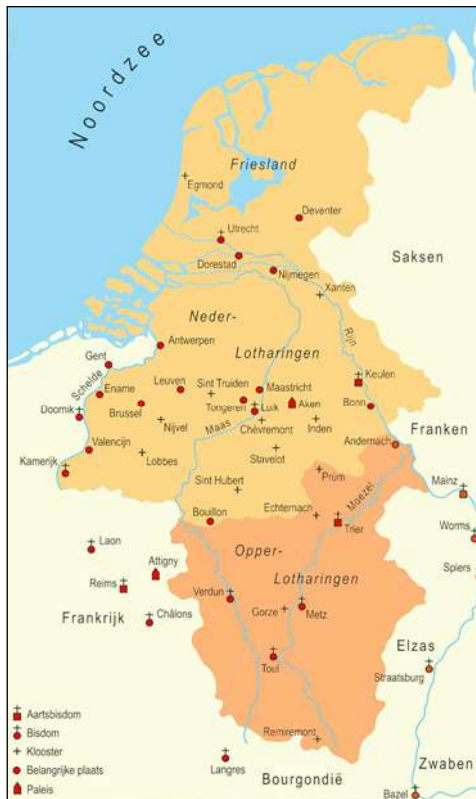
Kaart van Opper- en Neder-Lotharingen in de 10 de en 11 de eeuw, uit Geschiedenis van Brabant – Van het Hertogdom tot heden , p. 44, Red. R. VAN UYTVEN et alii , Zwolle 2004