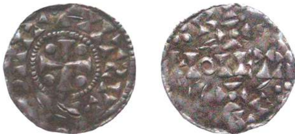
Fig. 4 – Dbg. 142 (schaal 200%)

Onze eerste halte in deze zoektocht was het Penningkabinet van de Koninklijke Bibliotheek te Brussel, dat inderdaad vier gelijkaardige denarii bezit [9] : een kwalitatief goede Dbg. 142 (1,13 g) – een gebrekkig geslagen stuk dat vermoedelijk een Dbg. 142 is (0,93 g) – een kwalitatief goede Dbg. 142a, die echter verkeerd is geïdentificeerd als een Dbg. 142b (1,17 g) – een gebrekkig geslagen Dbg. 142b (zij het met een iets afwijkende keerzijde; massa: 0,93 g). Maar geen enkel van deze stukken stemt exact overeen met onze denarius , die dus ontbreekt in de nationale verzameling. De kwalitatief goede eerste en derde denarius worden hierna afgebeeld [10] ; beide hebben een diameter van 18 mm.