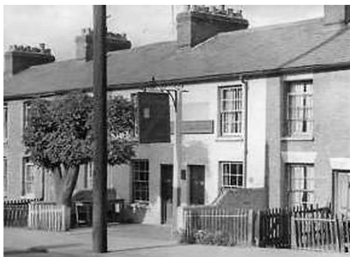
Tonbridge, Pembury Road 131-133