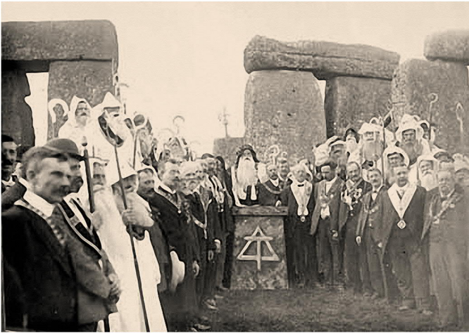
De Ancient Order of Druids aan een geïmproviseerd altaar in de cirkel van Stonehenge (foto dateert 1905)

De A.O.D. was de eerste vereniging die sinds 1905 regelmatig bijeenkwam in Stonehenge. Daar voerden ze allerlei rituelen uit zoals oa. tijdens de zomerzonnewende, de langste dag van het jaar.