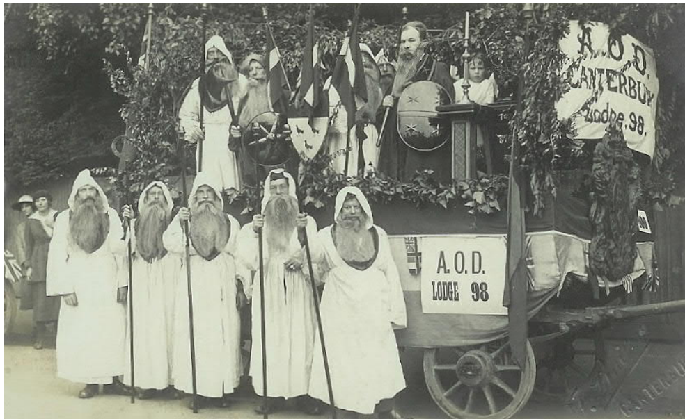
A.O.D. Canterbury Lodge N°98

Tijdens de bijeenkomsten werden meestal zaken van sociale aard besproken. De druiden waren voornamelijk gekend voor hun liefde voor muziek en liederen. Daarbij hielden ze zich ook bezig met rituelen zoals oa. het aanbidden van het vuur, een element dat in hun logo en op de beschreven medaille voorkomt.