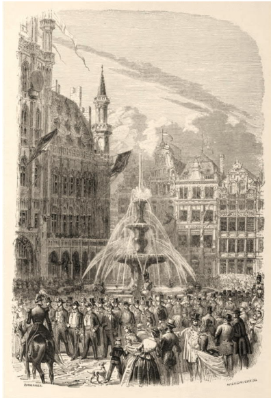
De fontein op de Grote Markt