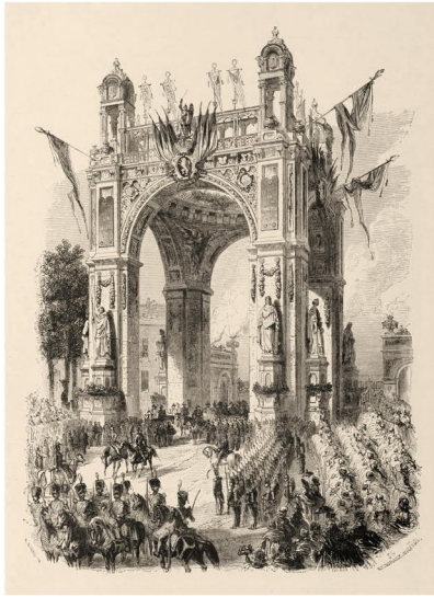
Triomfboog aan de Lakense Poort