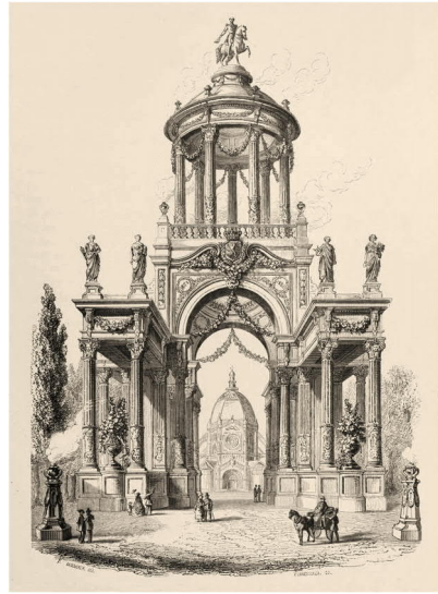
Triomfboog in de Koninklijke Straat