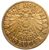
15 rupien goud 1916T