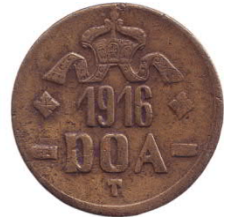
20 heller messing 1916T