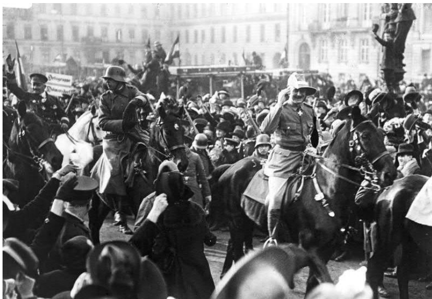
Parade te Berlijn in 1919 met rechts Paul von Lettow-Vorbeck te paard

Belgisch-Congo, een neutraal gebied net zoals België, vóór WO I, werd dan onverwittigd aangevallen via het Tanganyikameer. De Belgische kolonie vocht mee met twee brigades van de Force Publique onder leiding van de Belgische luitenant-generaal Charles Tombeur (1867-1945). Een langdurige patstelling tussen de Force Publique en het Duitse koloniale leger werd doorbroken door een gezamenlijk Brits-Belgisch offensief in 1916. De Force Publique behaalde een belangrijke overwinning door de verovering van Tabora op 19 september 1916. Dat was een unieke gebeurtenis in de Belgische militaire geschiedenis. Von Lettow-Vorbeck gaf zich pas over op 25 november 1918 in Abercorn (Rhodesia), twee weken na de wapenstilstand in Europa, want hij was niet eerder op de hoogte. Toen pas werd het duidelijk tegen welk een kleine Duitse troepenmacht de Britten met meer dan 100.000 man hadden gestreden. De troep telde op dat moment slechts 155 Duitsers en een paar duizend zwarten.