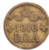
5 heller messing 1916T

In het bijzonder over het slaan van de gouden munten zijn interessante verhalen bewaard gebleven. Schumacher, toen 32 jaar oud, liet door 200 dragers in 10 dagen een kleine 300 kg goud brengen van de Sekenkemijn naar het station van Tabora waar hij een werkplaats inrichtte om munten te slaan. Hij gebruikte een wals bedoeld om rubber platen te maken om het goud op de juiste dikte te walsen. Met een kleine handpers ponste men er dan muntplaatjes uit. De walsmachine was natuurlijk niet erg nauwkeurig en dus liet hij de muntplaatjes iets te dik walsen en dan bijvijlen door 7 Singalese goudsmiden (afkomstig van Ceylon) die hij ter beschikking had, tot een gewicht van 7,168 g. Die konden ieder 30 muntplaatjes per dag maken. Hij had natuurlijk ook geen schroefpers en liet een manueel bediende hydraulische pers om buizen te buigen ombouwen tot muntpers. Na 2,5 maand zo gewerkt te hebben ging de hydraulische pers stuk en werd uitgeweken naar Lulanguru, 25 km ten westen van Tabora. Daar liet hij een pers bedoeld om olie te persen uit pinda's ombouwen tot muntpers. Deze was met stoom aangedreven en dat maakte het werk een stuk eenvoudiger en sneller. Zo kon Schumacher 6395 gouden munten slaan in Tabora en nog eens 9803 in Lulanguru.