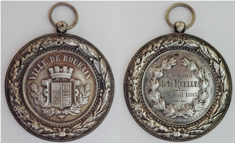
Stadsmedaille anoniem 19 de eeuw (met draagoog) van de stad Roubaix gevat in een extra rand, versierd met eikentak en lauwertak. Met sierrand 48 mm, zonder sierrand 33 mm, Ag (zilvermerk langs de rand), 18 g (verzameling Mannaert).