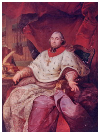
De Sint-Lambertuskathedraal te Luik in 1780 en de prins-bisschop François de Méan (deze werd in 1818 bij het ontstaan van de Nederlanden aartsbisschop te Mechelen).

Michel Stievenart (°2 dec 1910 Bergen, †18 dec 1991 Bergen)