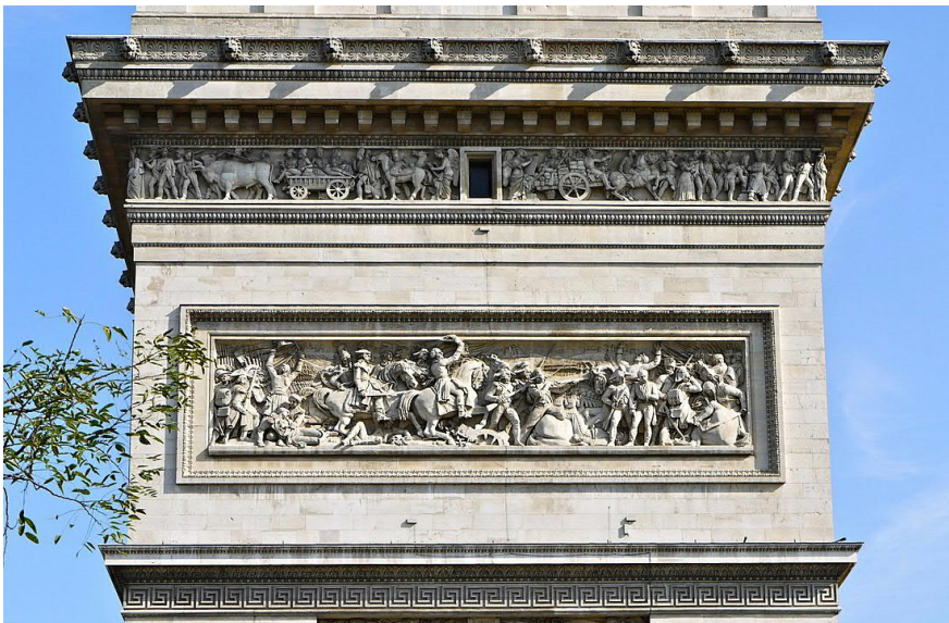
Bas-relief van de Slag bij Jemmapes op de Arc de Triompf te Parijs, kant Avenue Kléber