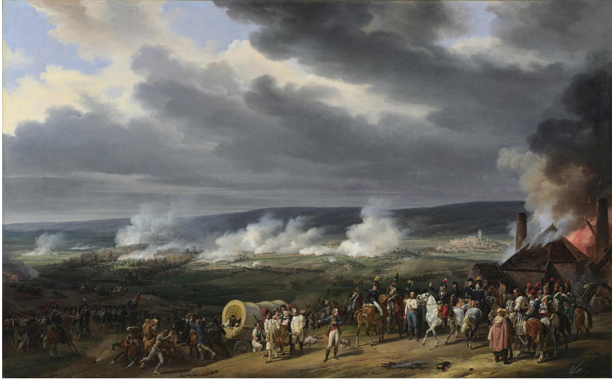
Slag bij Jemmapes op 6 november 1792, schilderij uit 1834 van Henry Scheffer (1798-1862) naar het origineel van Horace Vernet (1789-1863)

Een Frans leger, aangevuld met zo'n 2500 revolutionairen uit het prinsbisdom Luik en de Zuidelijke Nederlanden, aangevoerd door generaal Charles-François Dumouriez, behaalde, dankzij een numeriek overwicht (40.000 tegen 26.000) de overwinning op het Oostenrijks-Zuid-Nederlandse leger dat onder aanvoering van hertog Albert Casimir van Saksen-Teschen stond. Deze overwinning leidde tot de bezetting (of de bevrijding naargelang het gezichtspunt) van de Oostenrijkse Nederlanden.