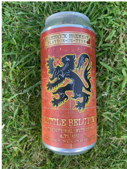
Hedendaags UK-bier: Little Belgium Traditional 'witbier' 4,7 %

Elisabethville bestond uit 325 huisjes met drie slaapkamers, 342 huisjes met twee slaapkamers, 22 houten hutten en 24 hostels voor alleenstaande arbeiders. Sommige van de grotere huizen hadden zelfs tuinen. Daarnaast had de gemeenschap een eigen rooms-katholieke kerk, basisscholen en middelbare scholen, een ziekenhuis met 100 bedden, een bioscoop/recreatiezaal en keukens/eetzalen, wasserijen, badhuizen en een politiebureau. Er waren winkels zoals een slager, kruidenier, kleermaker, stoffenwinkel, schoenmaker, kapper, een overdekte markt met ijzerwaren en een fotograaf.