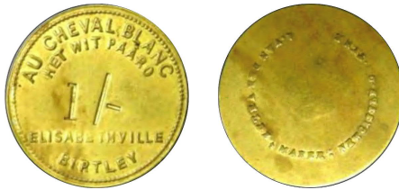
Het Wit Paard Token met waarde 1/-