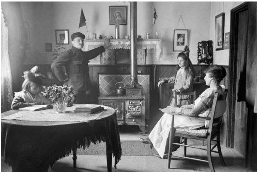
Impressie van een Belgisch gezin in het Birtley dorp.

De Belgische werknemers van de N.P.-fabriek woonden in hun eigen gesloten gemeenschap in Birtley, genaamd Elisabethville. In 1918 telde de gemeenschap \pm 6.000 mensen, waarvan 1.200 kinderen. De omheinde gemeenschap was volledig zelfvoorzienend en aanvankelijk gesticht op militaire leest, met een eigen lokale overheid en gendarmes. De oppositie tegen het bestuur leidde echter tot een ernstige rel in december 1916, waardoor de legerdiscipline werd versoepeld.