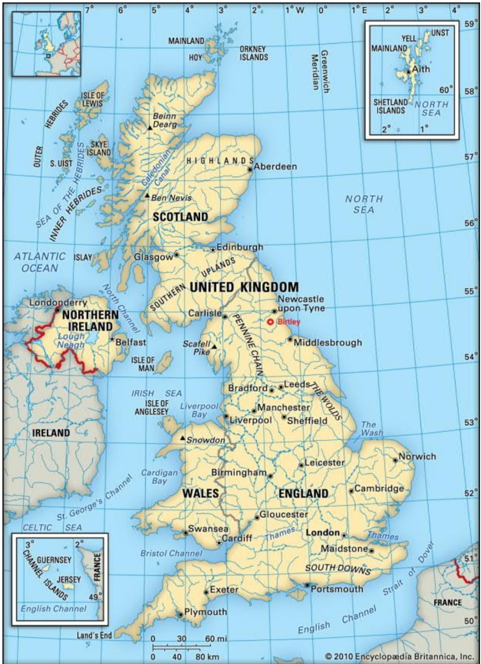
Birtley, County Durham (deel van Tyne & Wear), Engeland. National Factory Area No. 1

Bijna alle voormalige gebouwen van de N.P.F. zijn na de definitieve sluiting van de site in 2013 gesloopt. Er zijn nog maar een paar gebouwen over die ooit deel uitmaakten van de 'Belgische Kolonie' van Elisabethville.