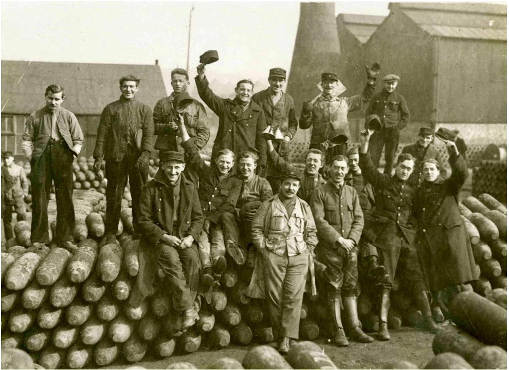
De Belgische munitiewerkers aan het N.P.F. in Birtley. Zij waren herkenbaar aan hun typische platte petten.

De N.P.-fabriek werd in opdracht van het Ministerie van Munitie door Sir W.G. Armstrong Whitworth & Company gebouwd, die een soortgelijke bestaande fabriek reeds op een aangrenzende locatie exploiteerde. De bouw begon in 1915 met een aanvankelijk beperkte productie en bereikte de volledige capaciteit in 1916. De fabriek bleef tot het einde van de oorlog in 1918 operationeel. Daarna werd het een granaatfabriek totdat deze in 2013 werd verplaatst naar Washington, Tyne & Wear (enkele kilometers voorbij Birtley), onder de toenmalige eigenaren B.A.E. Systems Limited.