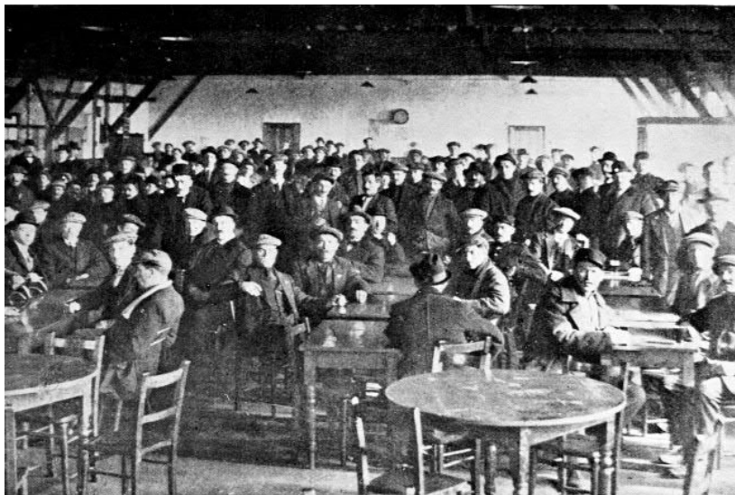
Deze foto die in 1917 in het 'Witte Paard' werd genomen, geeft een duidelijk beeld waar deze penningen werden gebruikt.

Groot-Brittannië is gekend voor het decennialange gebruik van tokens, m.a.w. ook de 'Birtley-belgen' hadden hun eigen tokens. Deze werden vervaardigd door Van Der Velde & Company, een bekende penningmaker uit het noordoosten van Engeland, die gevestigd was in Newcastle-on-Tyne.