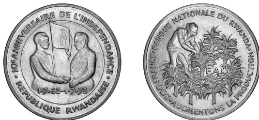
200 frank zilver 1972, 10 de verjaardag van de onafhankelijkheid, Ø 32 mm 18,2 g, Ag 80 % Cu 20 %, Royal Mint Londen

In 1965 werden gouden herdenkingsmunten uitgegeven van 100, 50, 25 en 10 frank met het hoofd van president Kayibanda in een beperkte oplage. Waarschijnlijk wilden ze niet achterblijven tegenover Congo en Burundi die ondertussen ook al gouden munten uitgegeven hadden met het hoofd van de president op. Merk op dat hier als datum van de onafhankelijkheid 1961 opgegeven wordt, het jaar dat Kayibanda de republiek uitriep, en niet de officiële onafhankelijk die er maar in 1962 kwam.