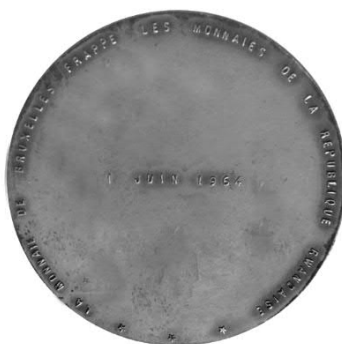
Zilveren herdenkingsmedaille Ø 45mm geslagen op 1 juni 1964 te Brussel