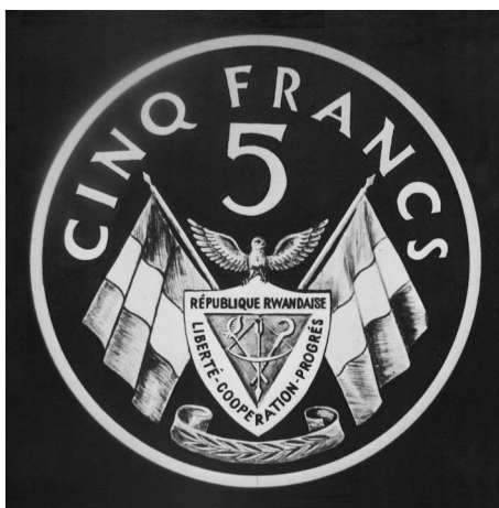
De ontwerptekening van Carlos Van Dionant

Uiteindelijk heeft dit alles geleid tot de officiële bestelling van 14 april 1964. De bestelling omvatte 3 miljoen 1 Fr stukken in koper-nikkel (Cu75 Ni25) met gladde rand, 4 miljoen 5 Fr stukken in brons (Cu95 Sn3 Zn2) met kartelrand en tenslotte 6 miljoen 10 Fr stukken in koper-nikkel (Cu75 Ni25) met gladde rand. De prijs die de Koninklijke Munt hiervoor aan Rwanda heeft gevraagd was 0,35 Bfr voor de 1 Fr stukken, 0,50 Bfr voor de 5 Fr stukken en 0,75 Bfr voor de 10 Fr stukken, transport- en verzekeringskosten niet inbegrepen.