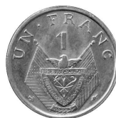
5 Fr brons en 1 Fr koper-nikkel 1965