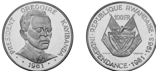
100 frank 1965, Ø 33 mm 30 g, Au 90 % Cu 10 %, Argor Zwitserland

In de Koninklijke Munt te Brussel zijn na 1965 geen munten meer vervaardigd voor Rwanda. In oktober 1976 is er nog een offerte gemaakt voor een nieuwe muntenreeks van 1 Fr, 5 Fr, 20 Fr en 50 Fr, doch zonder resultaat. Andere munthuizen voerden deze muntslag uit.